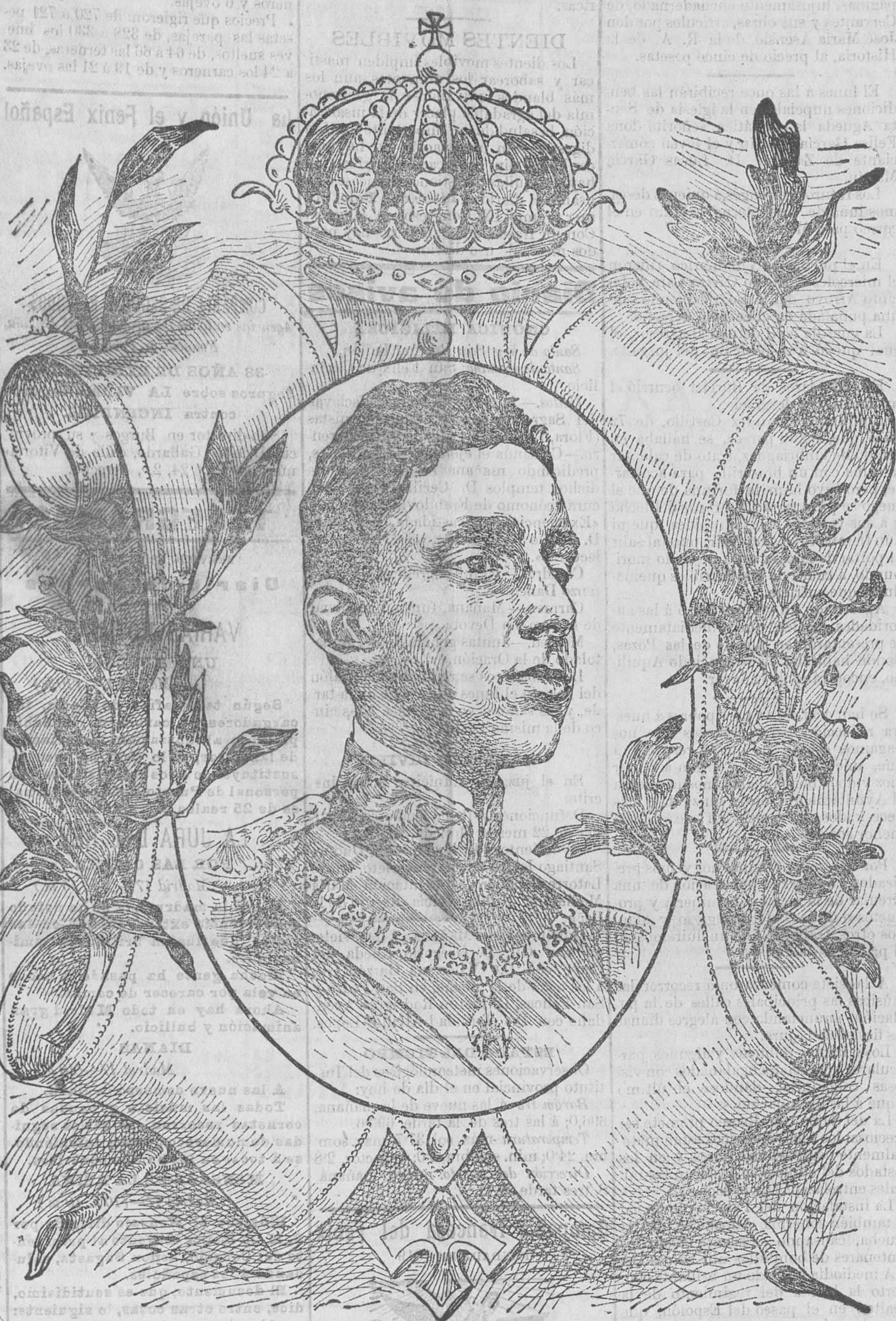
S. M. el Rey Don Alfonso XIII.

Ceremonial La Gaceta publica el ceremonial que se observará en la solemnidad del juramento que, conforme al art. 45 de la Constitución de la monarquía, ha de prestar ante las Cortes S. M. el Rey don Alfonso XIII. Dice así: 1.º SS. MM. el Rey y la Reina Regente, acompañados de la Real Familia, saldrán de Palacio a la una y media de la tarde, dirigiéndose por la plaza de Armas, saliendo por la puerta central de la verja, plaza de la Armería, calle de Bailén, calle Mayor, Puerta del Sol, Carrera de San Jerónimo al Palacio del Congreso. 2.º Veintidós cañonazos anunciarán la salida de SS. MM. y Real Familia de Palacio. 3.º Las tropas de la guarnición cubrirán la carrera. 4.º SS. MM. y Real Familia serán recibidos y despedidos en el Palacio del Congreso por comisiones de ambos Cuerpos Colegisladores en la forma acostumbrada. 5.º Una vez en presencia de las Cortes, S. M. el Rey pondrá su mano derecha sobre los Santos Evangelios y jurará por sí mismo el siguiente juramento: «Juro por Dios, sobre los Santos Evangelios, guardar la Constitución y las leyes. Si así lo hiciere, Dios me lo pague, y si no, me lo demande.»