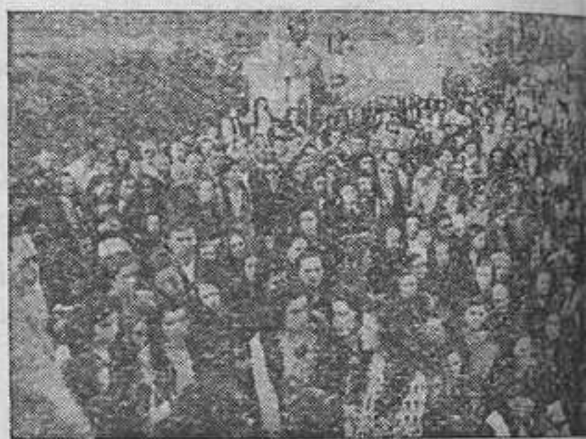
El Excmo. señor Presidente de la

Poco después, escalaba la montaña la cabeza de la procesión, entre el alegre campaneó de la Colegiata de Gandía, de las torres de las Esclavas de Benirredrá, y de Real de Gandía, a las que se unían, el disparo de cohetes en algunas casas del tránsito y el incesante canto del Trisagio, a lo largo de la procesión, sostenido por dos secciones de la banda de música, convenientemente espaciadas. Llegado el Santísimo a la Montaña, comenzaba a clarear tímidamente. Tres sacerdotes se ponen de nuevo a confesar, mientras el P. Barquero comienza la Misa y el P. Rodríguez, su exhortación, para mejor comulgar y ganar el Jubileo. Llegado el momento de la Comunión, aparece el Sol, deseoso de presenciar aquel espectáculo de cielo. Se reparten, contadas, algo más de 1.200 (mil doscientas) comuniones. El coro de cantoras de Real de Gandía, hechía entre tanto el aire matinal de preciosos motejes. Terminada la primera misa, dice el P. Rodríguez la segunda, que también oye gran muchedumbre de fieles. Mientras los restantes, o se esparcen por la montaña, para desayunar, o toman por diversas veredas el camino de Gandía o de sus pueblos respectivos, hasta volver, a la tarde.