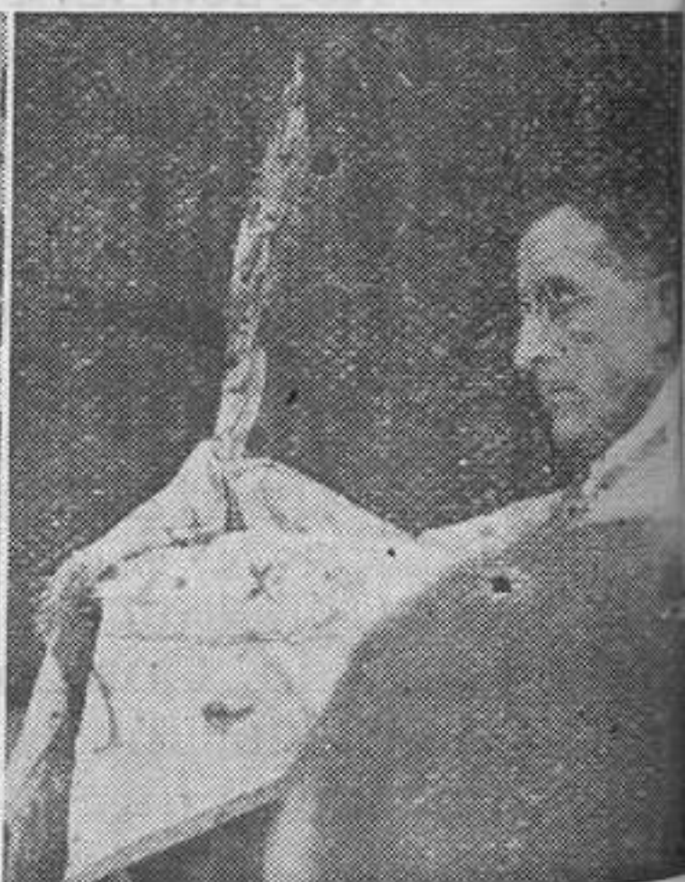
Jesús desde la Custodia bendice a la muchedumbre, al pie de su Monumento