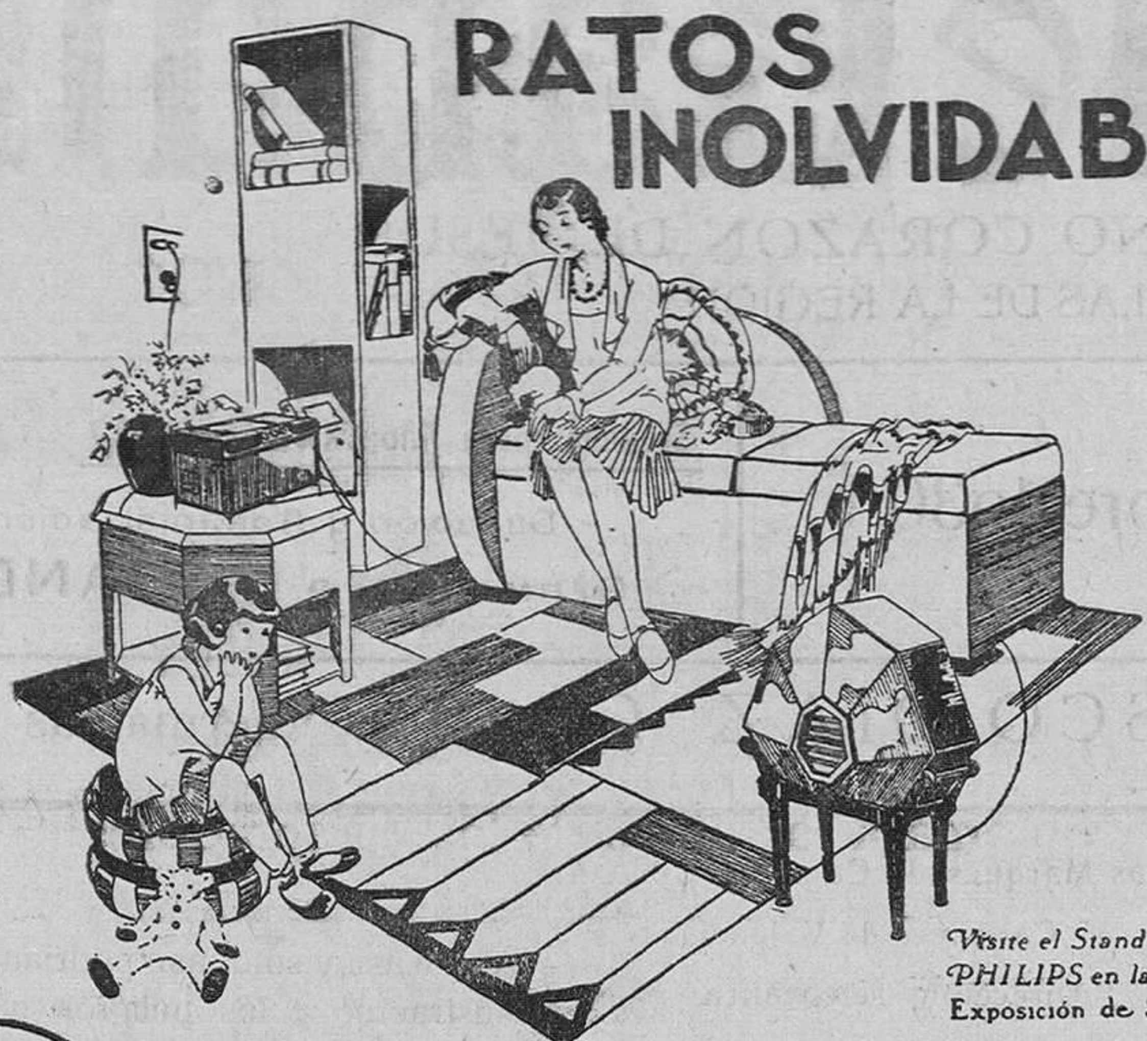
Visite el Stand PHILIPS en la Exposición de Sevilla

Ratos inolvidables de deleite espiritual proporcionan a sus poseedores el RECEPTOR PHILIPS DE LUJO, CON ENCHUFE A LA LUZ Y CON ALTAVOZ ELECTRODINÁMICO. Los más grandes artistas dentro de cada hogar, con fidelidad asombrosa de reproducción y a través de un aparato que es realmente un objeto de arte.