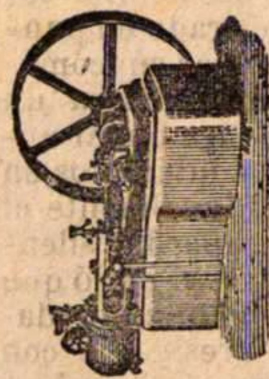
Máquina de vapor horizontal.