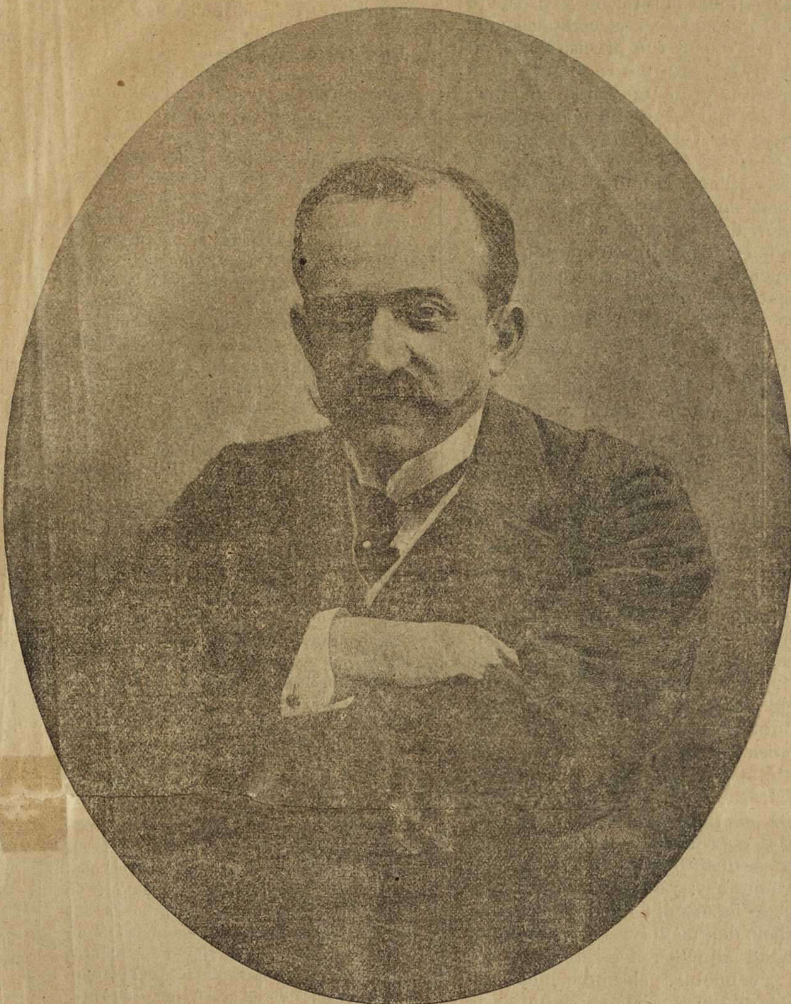
Excmo. Sr. Conde de Romanones

No venimos á formar en la Prensa para hacer política personal y de encrucijada; venimos con la cabeza levantada, mirando alto, y sentiríamos que esta aspiración nuestra sufriera retroceso por la vilan-