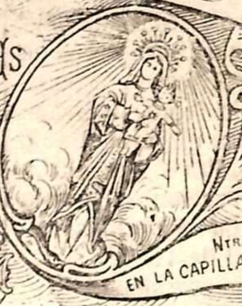
NTRA SRA DE FONTILLES EN LA CAPILLA DEL ALTAR MAYOR