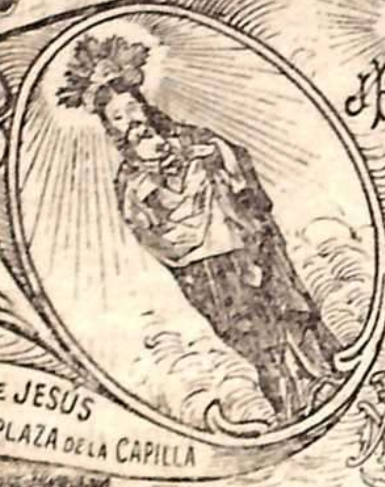
SAGRADO CORAZÓN DE JESÚS SOBRE EL PEDESTAL EN LA PLAZA DE LA CAPILLA