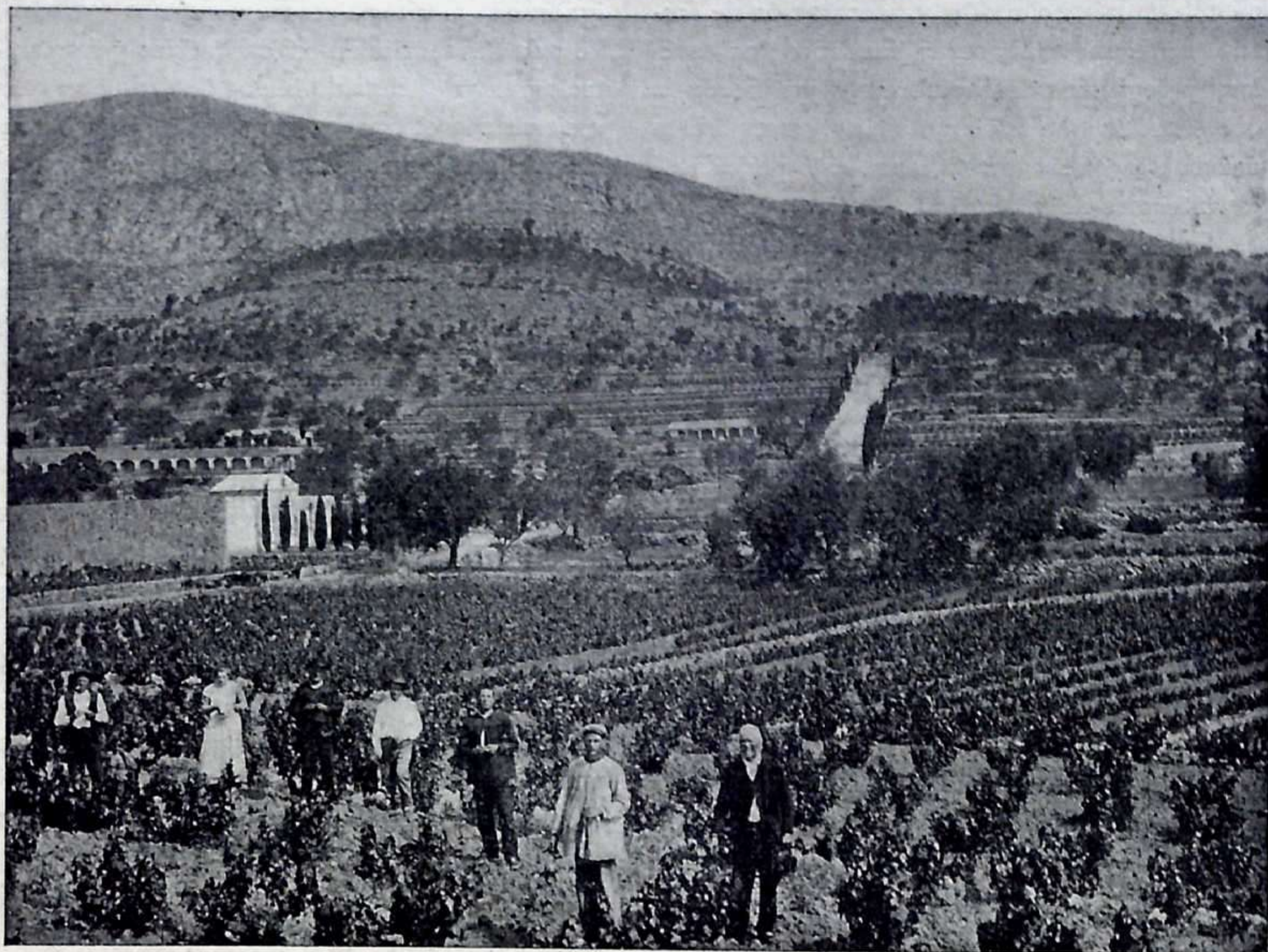
VISTA DEL CEMENTERIO Y VÍA-CRUCIS DE ALCAHALÍ

Marina por no obstruir la construcción del Sanatorio para leprosos en término de Laguar.