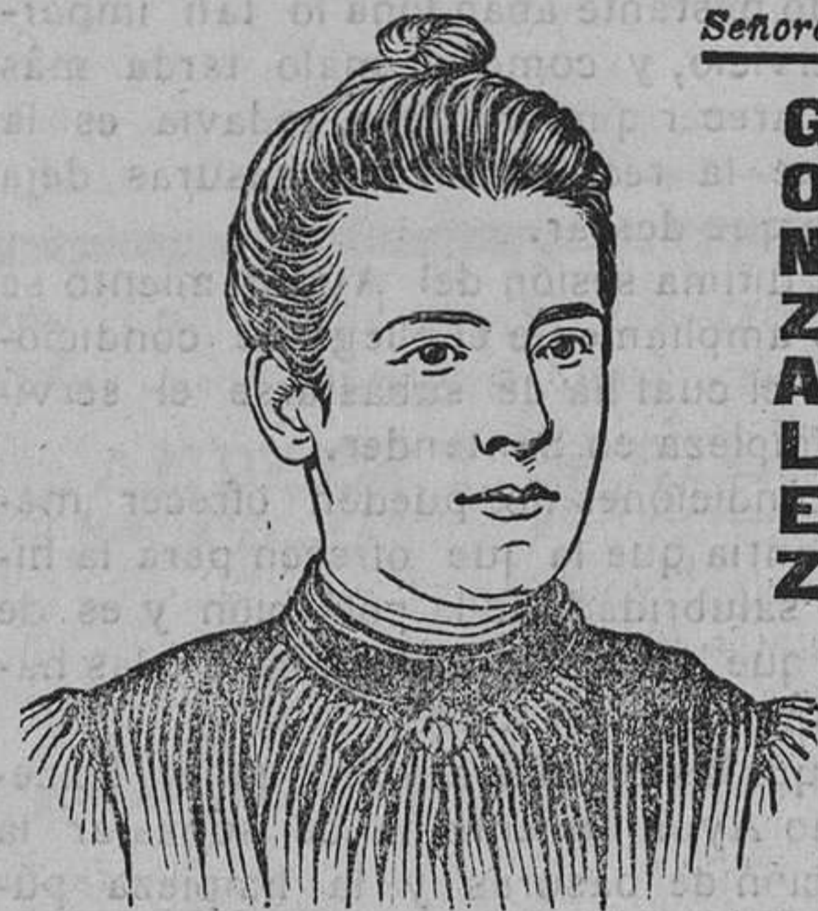
Barcelona 23 de Abril de 1901.