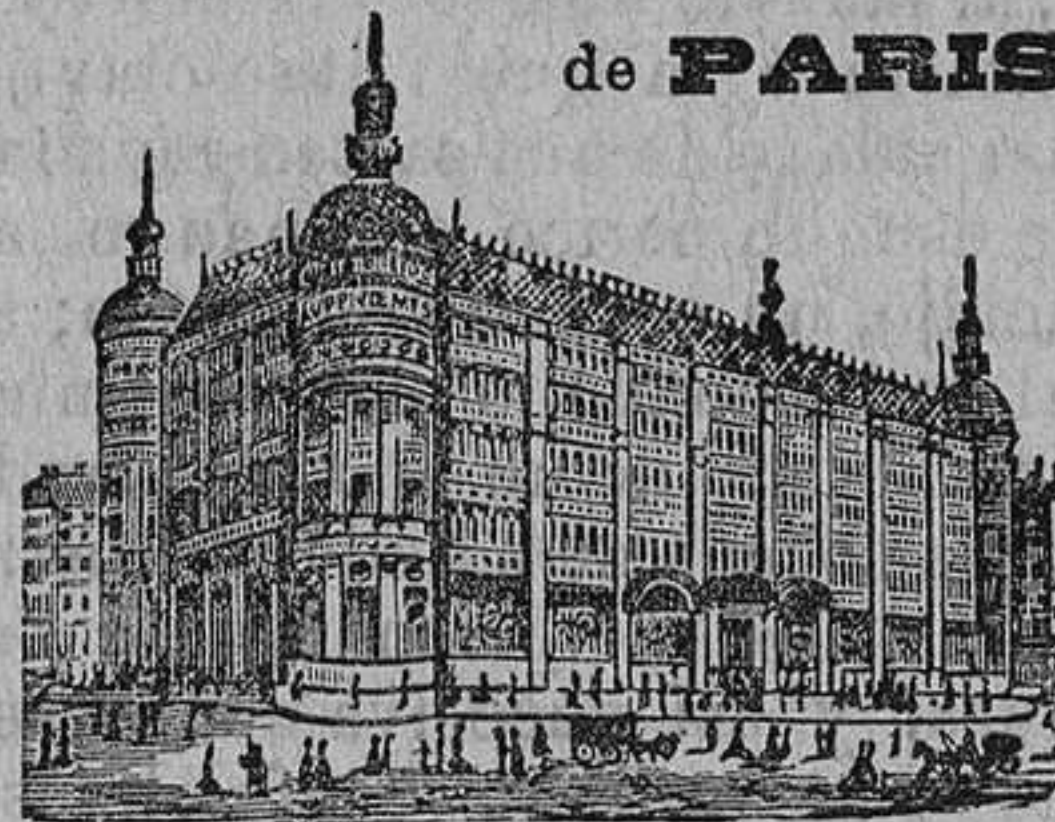
GRANDES ALMACENES DEL