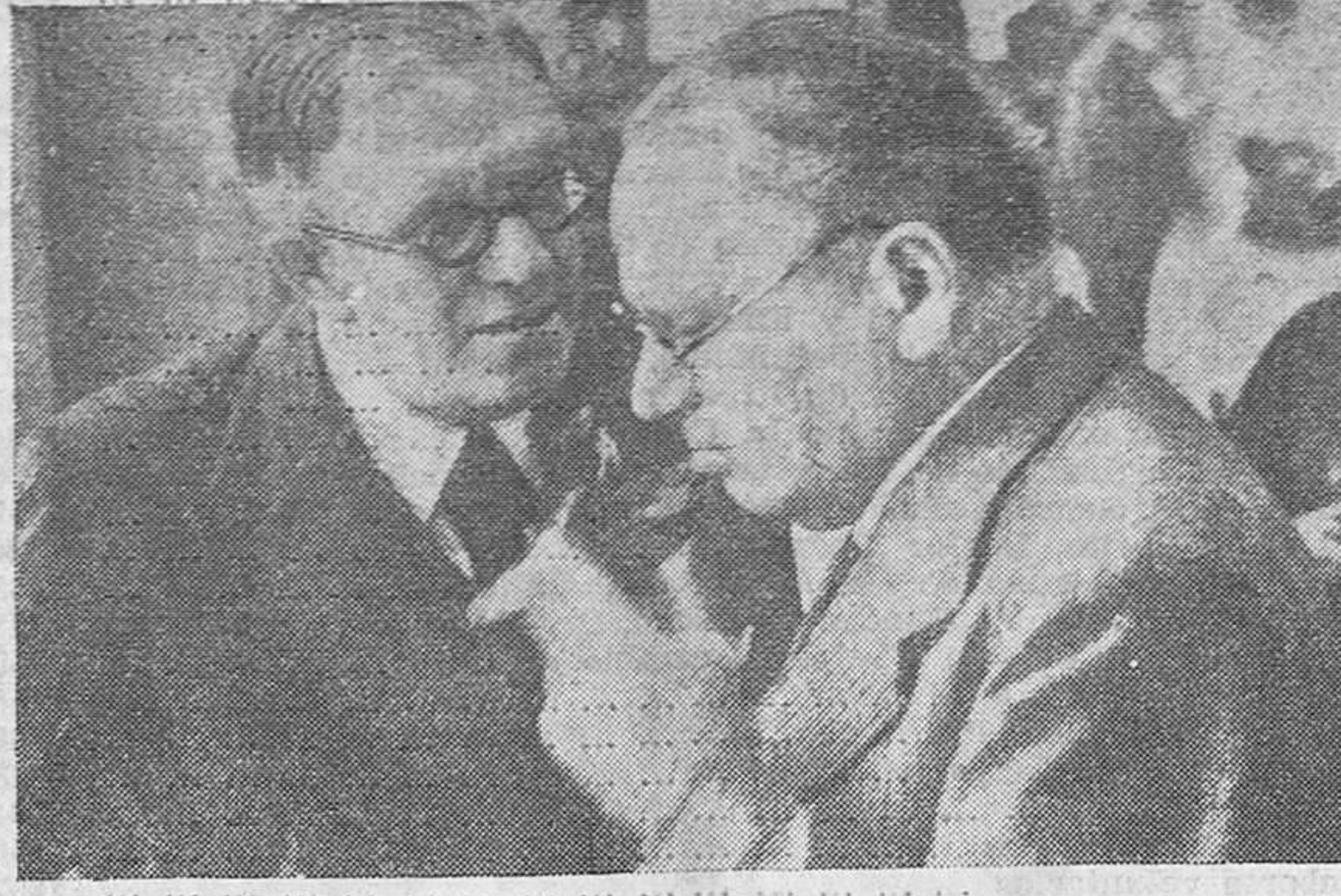
LA GUERRA CIVIL EN ESPAÑA. — En los pasillos de los salones donde se reúne la Sociedad de las Naciones, los señores Litvinov, comisario de Relaciones Exteriores de Rusia, y el ministro de Estado español, señor Álvarez del Vayo, sostienen interesante conversación.

Y después de afirmarnos que la tranquilidad en toda la provincia es absoluta, el gobernador civil se despidió de los periodistas.