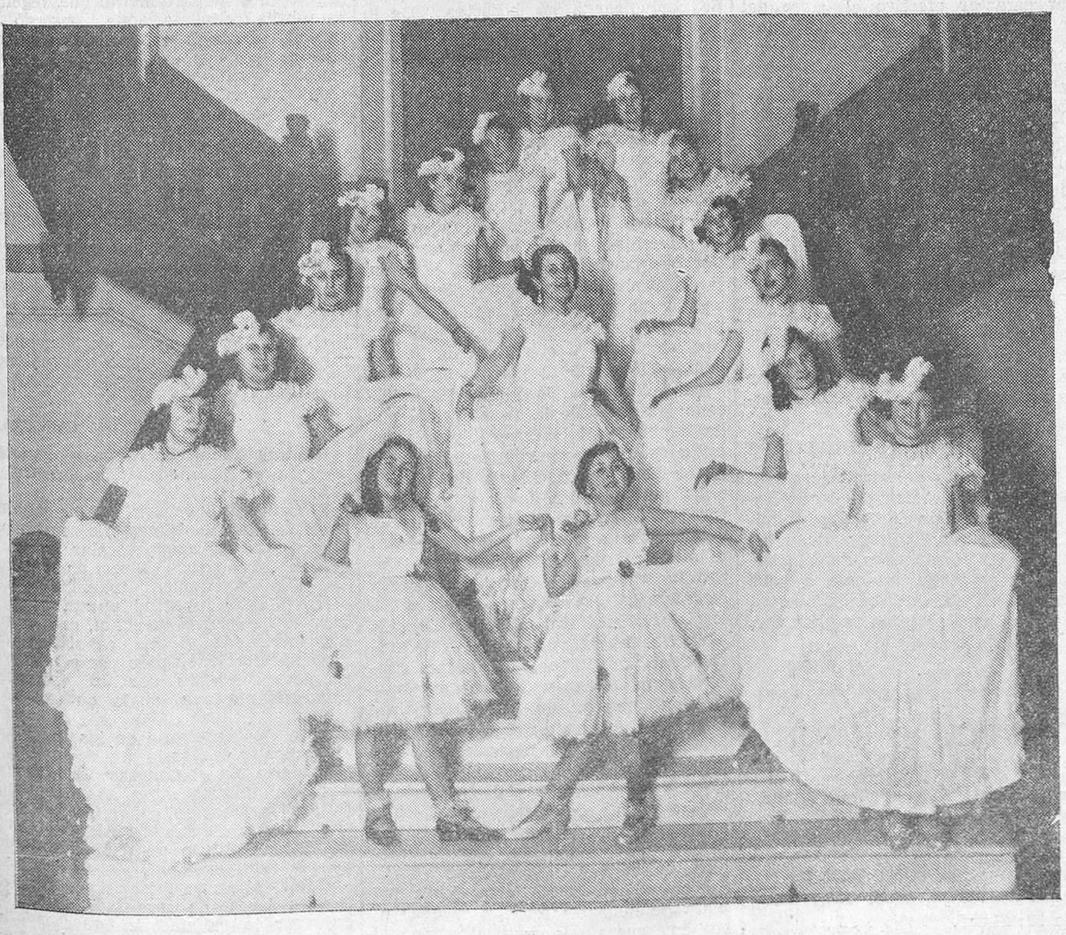
EN EL GRAN CASINO. — Precioso cuadro de la función benéfica celebrada ayer en el Gran Casino.