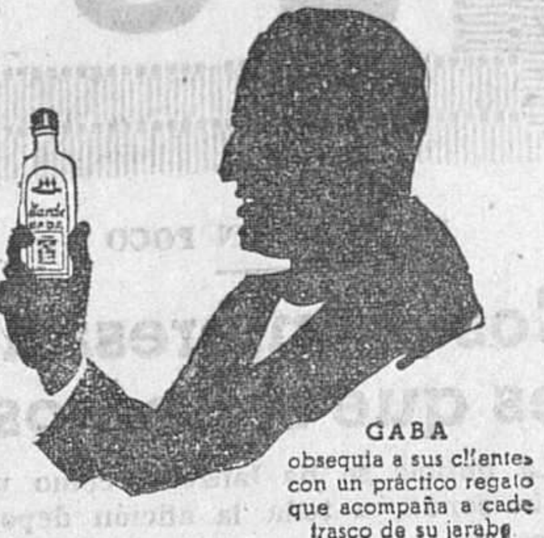
GABA obra en su alante con un práctico regato que acompaña a cada frasco de su jarabe

BLENORRAGIA (Purgaciones.) Curación radical, tanto las recientes como las crónicas tratándose uno mismo, con el tratamiento moderno SECRETOL Venta en farmacias.