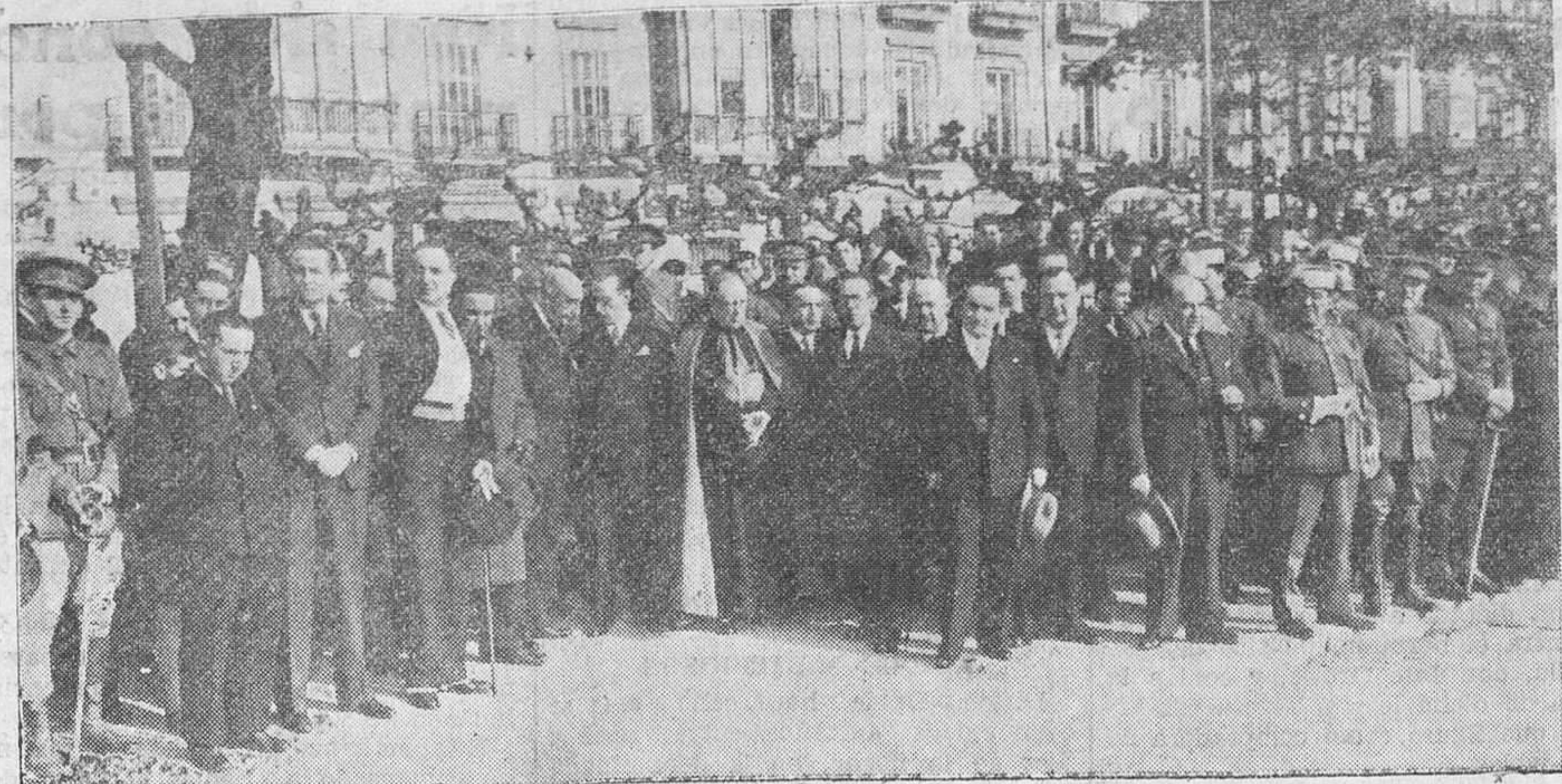
LA PROMESA DE LA BANDERA. — Autoridades y elementos militares, presenciando el desfile.

Desde que se proclamó la República no había sido prometida la bandera por los soldados en esta ciudad más que en el cuartel del paseo de Sánchez de Porúa.