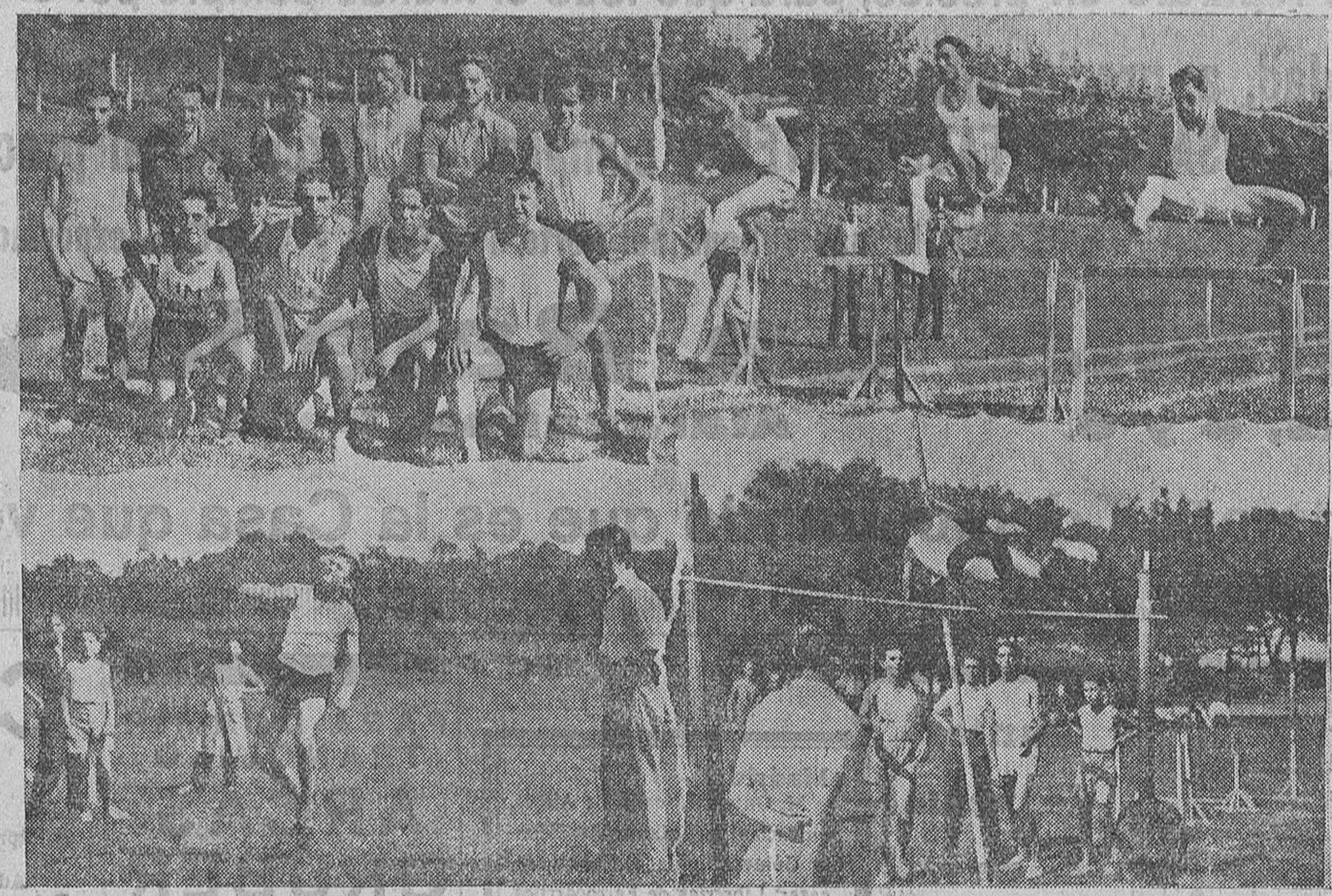
Cuatro notas gráficas de los concursos atléticos celebrados el pasado domingo en los campos de la Magdalena.

¡Chitón! Las cosas en su justo medio están bien. La crueldad no la aplaudimos. La Directiva del Racing ha obligado a los jugadores a leer seis veces los nueve discursos de los radicales. ¡Que no estamos en los tiempos de la Inquisición, señores directivos!