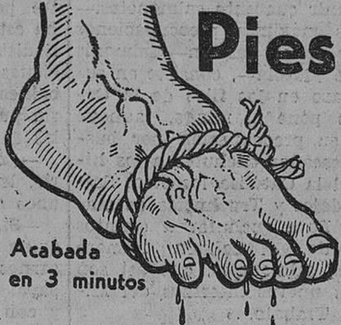
Acabada en 3 minutos

No se desespere Ud. pues pasaron ya aquellos tiempos en que era inevitable aguantar un suplicio de tortura en los pies. Actualmente puede Ud. librarse en el acto de las peores hinchazones, quemazón y demás dolores en los pies sensibles, sea cual fuere la causa. Compre simplemente un paquete de Salitros Rodell y eche un puñado de los mismos en agua caliente para un baño de pies. En el instante en que Ud. sumerja los pies en este baño oxigenado y curativo cesará toda inflamación en sus tejidos irritados; se restablecerá la circulación sanguínea de tal forma, que sus pies se encontrarán calmados y remozados. Con esta sencilla receta, diariamente millares de pacientes encuentran alivio en tres minutos, cuando vivían desesperados por creer que no había medio de poner término a sus males de pies. Los callos y durezas se reblandecen, pudiendo salirse por completo. Los Salitros Rodell son de éxito seguro, y por eso podemos garantizar su resultado. Adquiera hoy mismo un paquete de estas maravillosas sales y empiece el tratamiento esta noche y se convencerá. Los Salitros Rodell se recomiendan y venden, a un precio insignificante, en todas las farmacias, droguerías, perfumerías y centros de específicos.