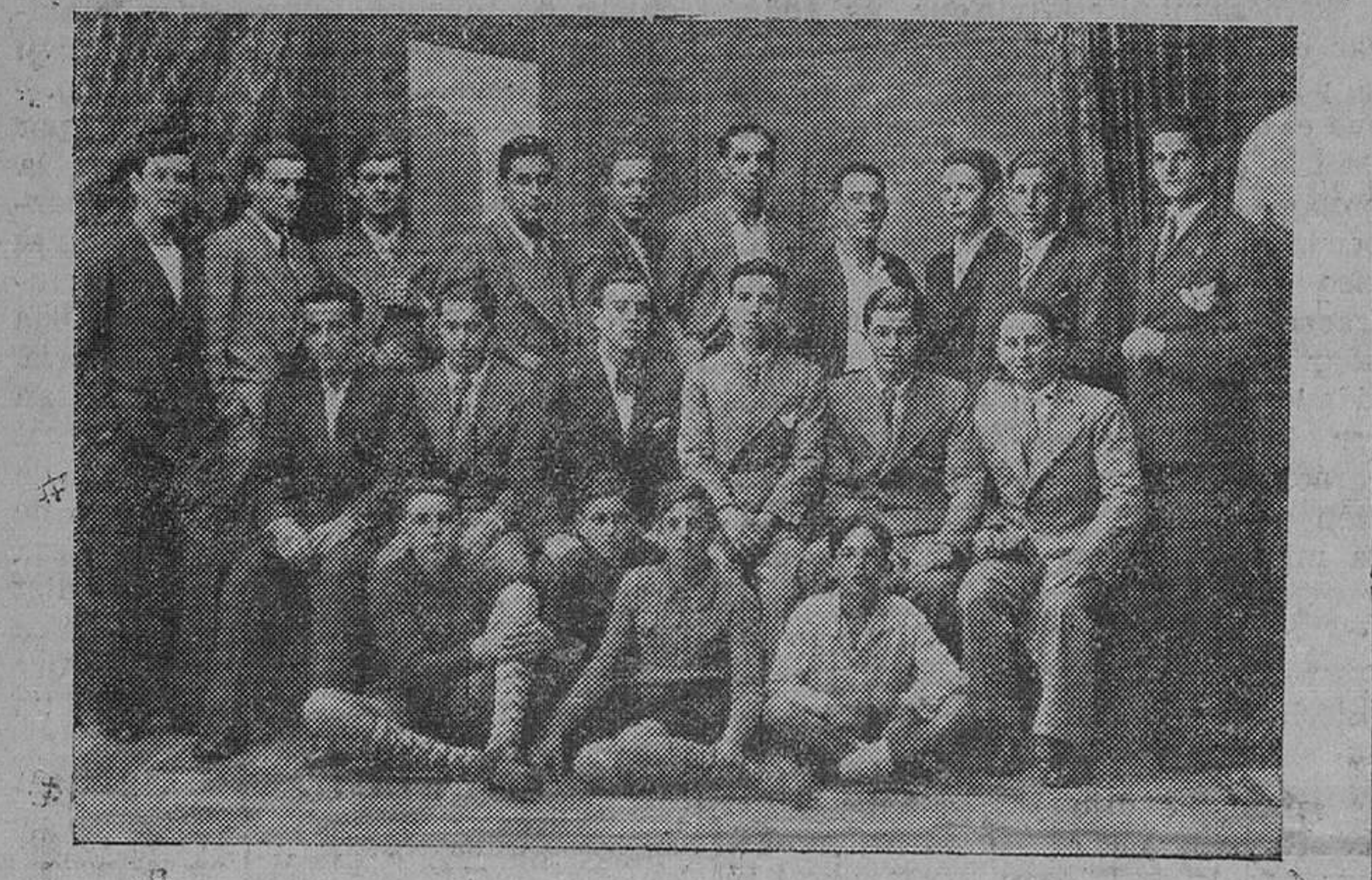
TORRELAVEGA. — Alumnos premiados en la Escuela de Artes y Oficios de esta ciudad, y autores de los principales trabajos que honran la magnífica exposición que celebra dicho centro.