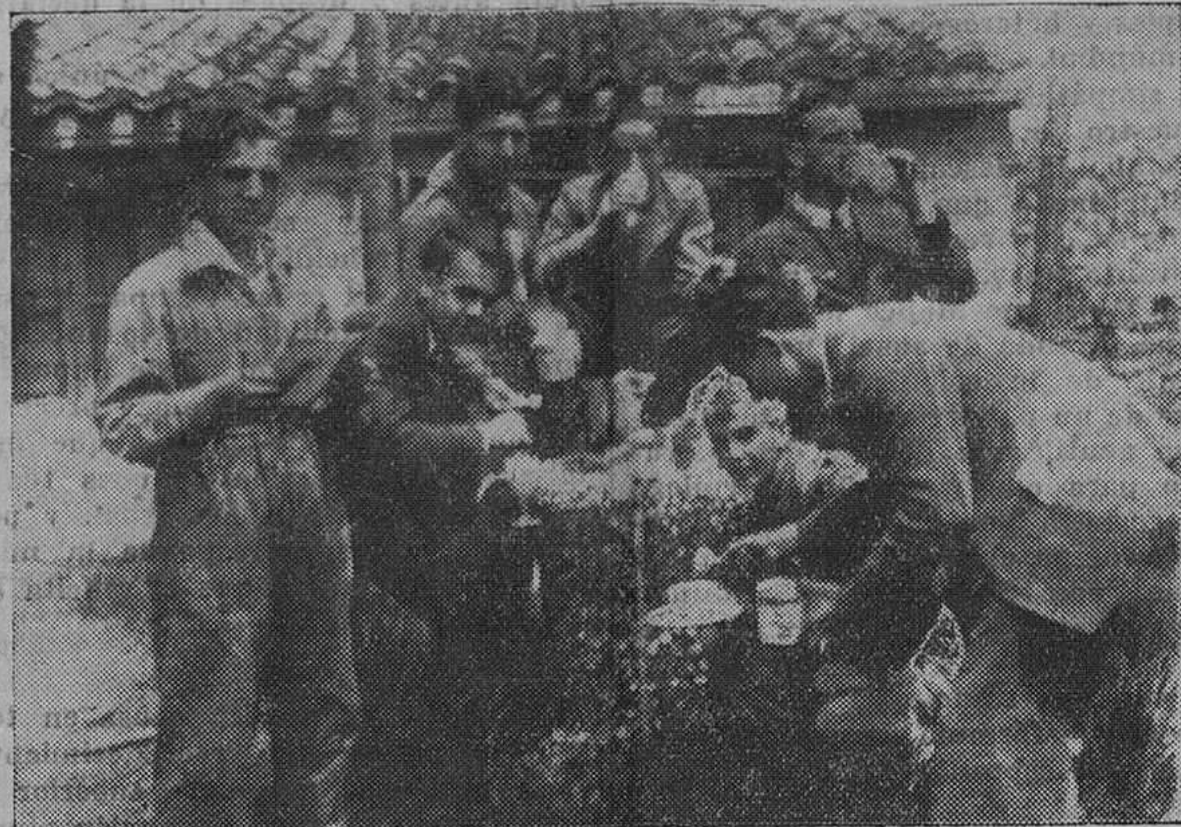
Los simpáticos andarrines asturianos que van a dar la vuelta a España, merendando con algunos amigos en Reinoso.

En el día de ayer marcharon a Asturias y otras regiones ganaderas tan simpáticos señores, los cuales han quedado tan encantados de las delicadas atenciones halladas en nuestra provincia, que fueron muy animados para repetir el año próximo su visita a la Montaña. Que así sea, y que las enseñanzas recogidas en nuestra provincia les sean de utilidad en su carrera.