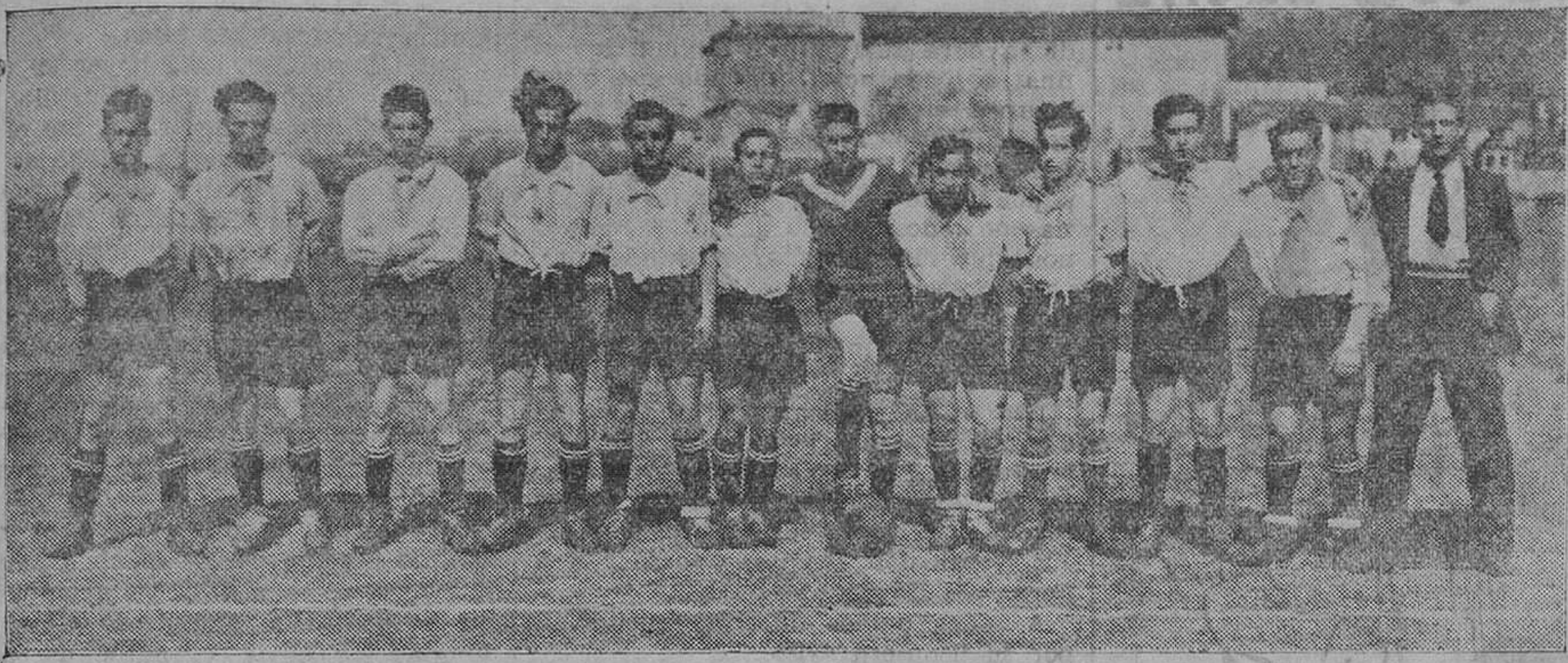
GALERIA DE CLUBS MODESTOS. — El New Royal.