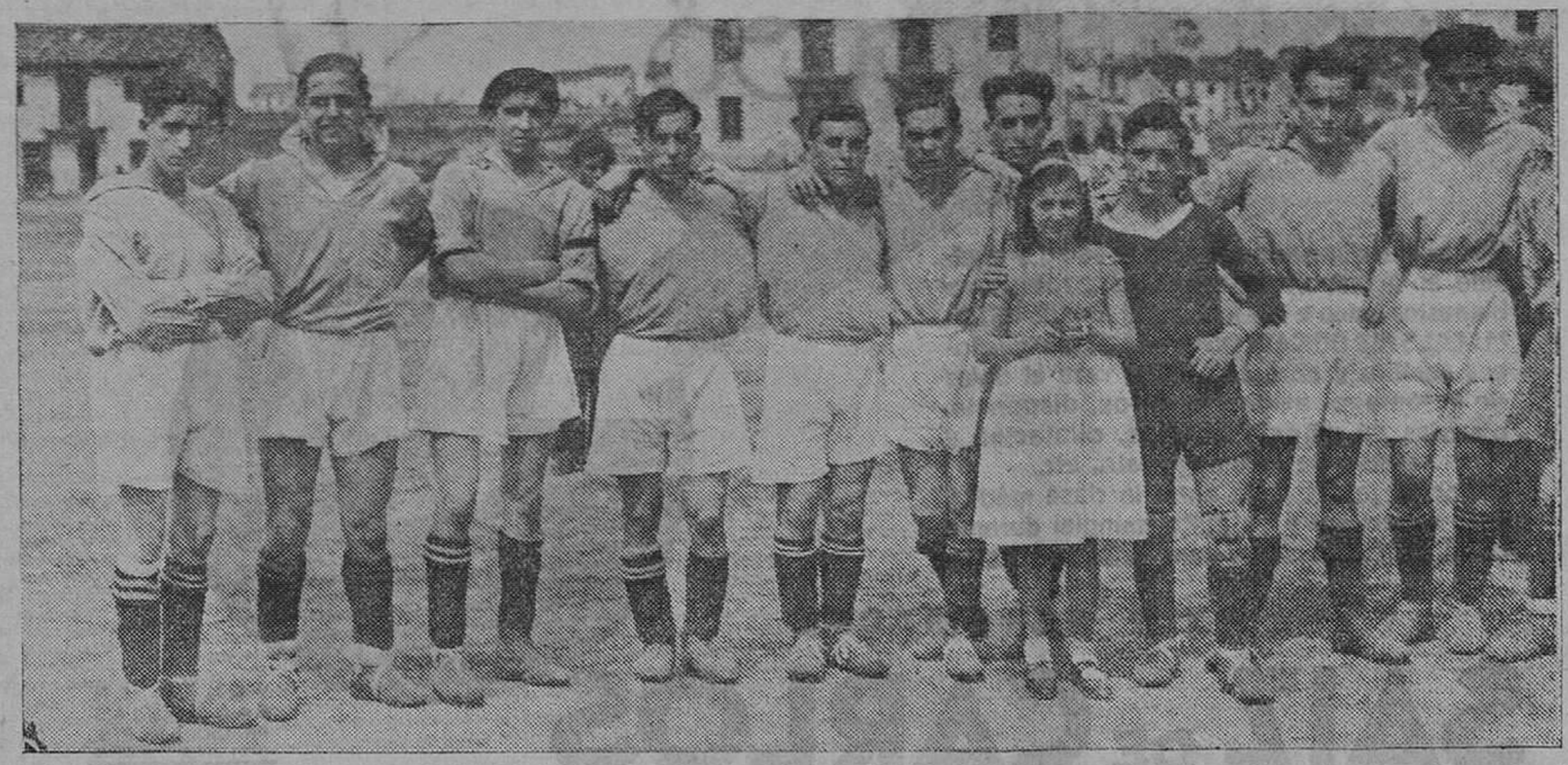
GALERIA DE CLUBS MODESTOS. — El Club Cantábrico.