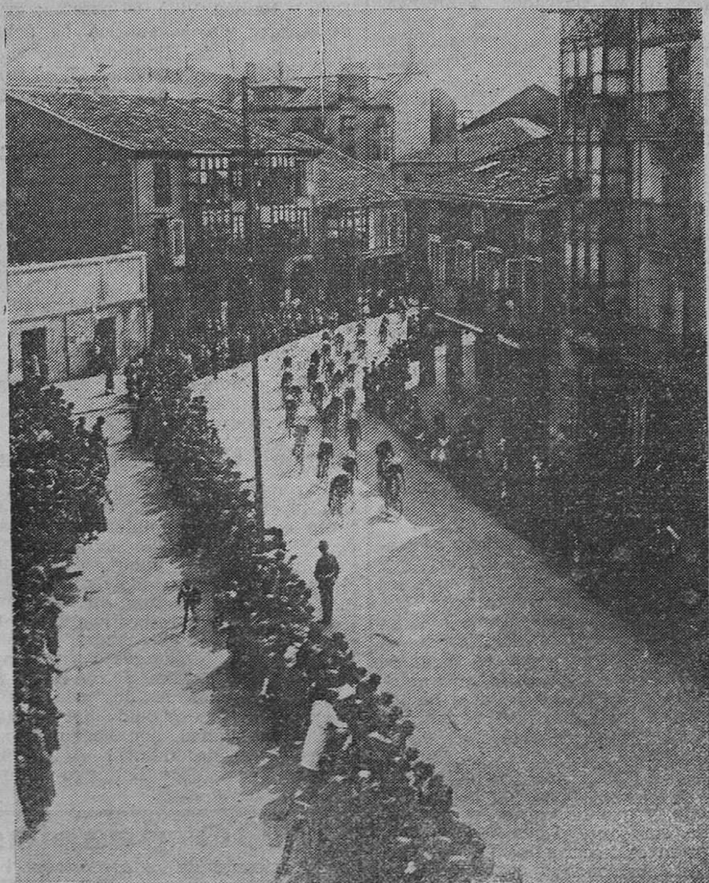
TORRELAVEGA. — Esta foto demuestra la perfecta organización que hubo en esta ciudad para presenciar el paso de los ciclistas que toman parte en la Vuelta a España.