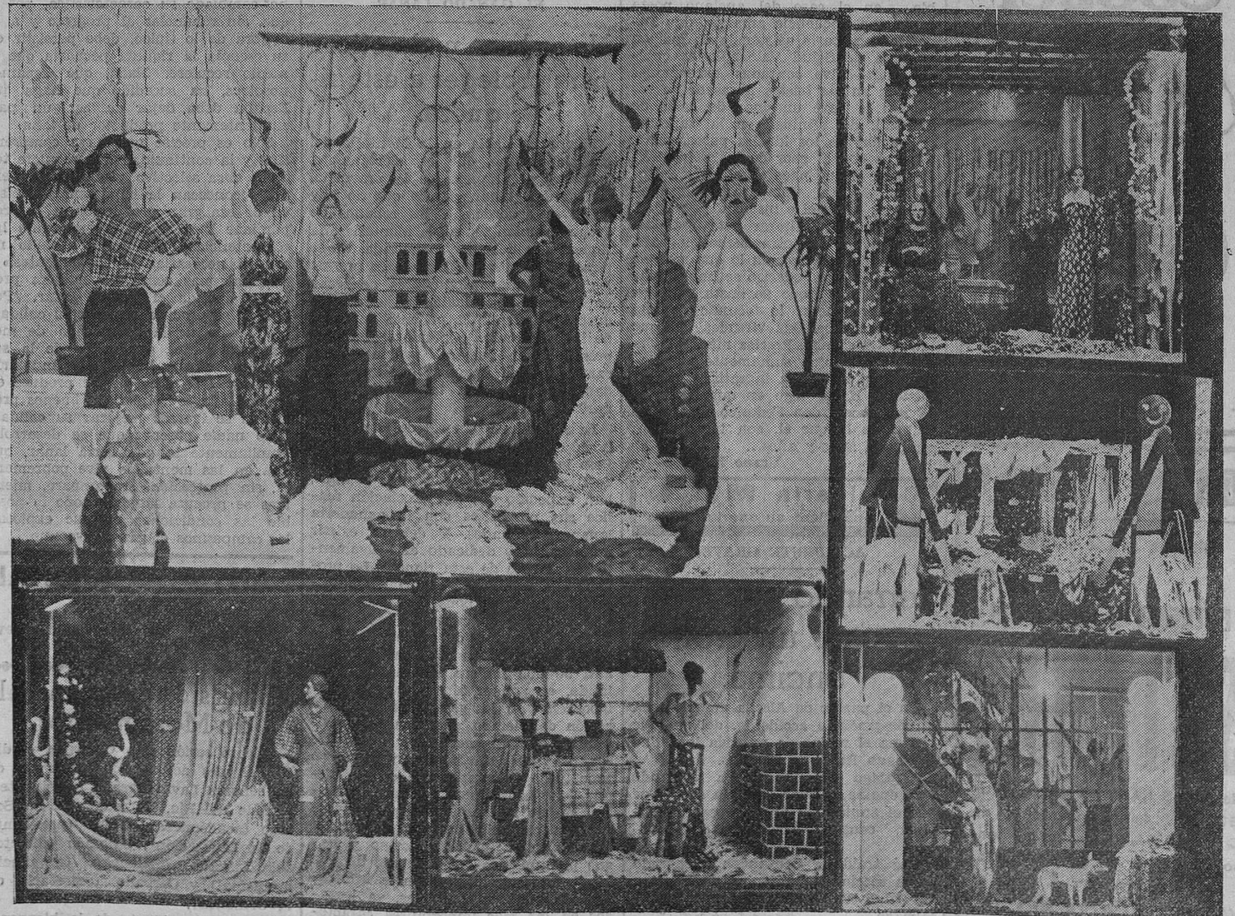
LOS ALMACENES «LA VERDAD». — Los maravillosos escaparates de los almacenes LA VERDAD han llamado poderosamente la atención del público durante el día de ayer. Se trata de una obra artística de primera calidad, donde el ingenio del escaparataista ha dominado la técnica para ofrecer al público las más variadas demostraciones de lo que puede hacerse con los inmejorables géneros que vende la Casa, donde se ofrecen por las diversas secciones los más variados artículos a precios sin competencia, para lo cual se ha introducido en su organización normas modernísimas, que constituyen una espléndida novedad para Santander. Los almacenes LA VERDAD son, sin disputa, los elegidos por el público, que en ellos encuentra todo lo que desea, a precios inverosímiles por su economía. Pasar un rato ante los escaparates de LA VERDAD es recrearse ante una obra de arte.

En el reglamento de Policía Urbana aprobado en la última sesión del Ayuntamiento de Madrid, la Guardia municipal podrá imponer y hacer efectivas en el acto, entre otras, multas por atravesar los peatones por sitio distinto a los pasos establecidos; no respetar las señales de circulación; formar grupos en las aceras, arrojar mondas de fruta, restos de marisco, papeles y desperdicios a la vía pública; fomentar la mendicidad dando limosnas en la vía pública; proferir palabras groseras o deshonestas, exhibición de carteles y dibujos ofensivos o subversivos, cánticos alusivos a ideas políticas, etc.