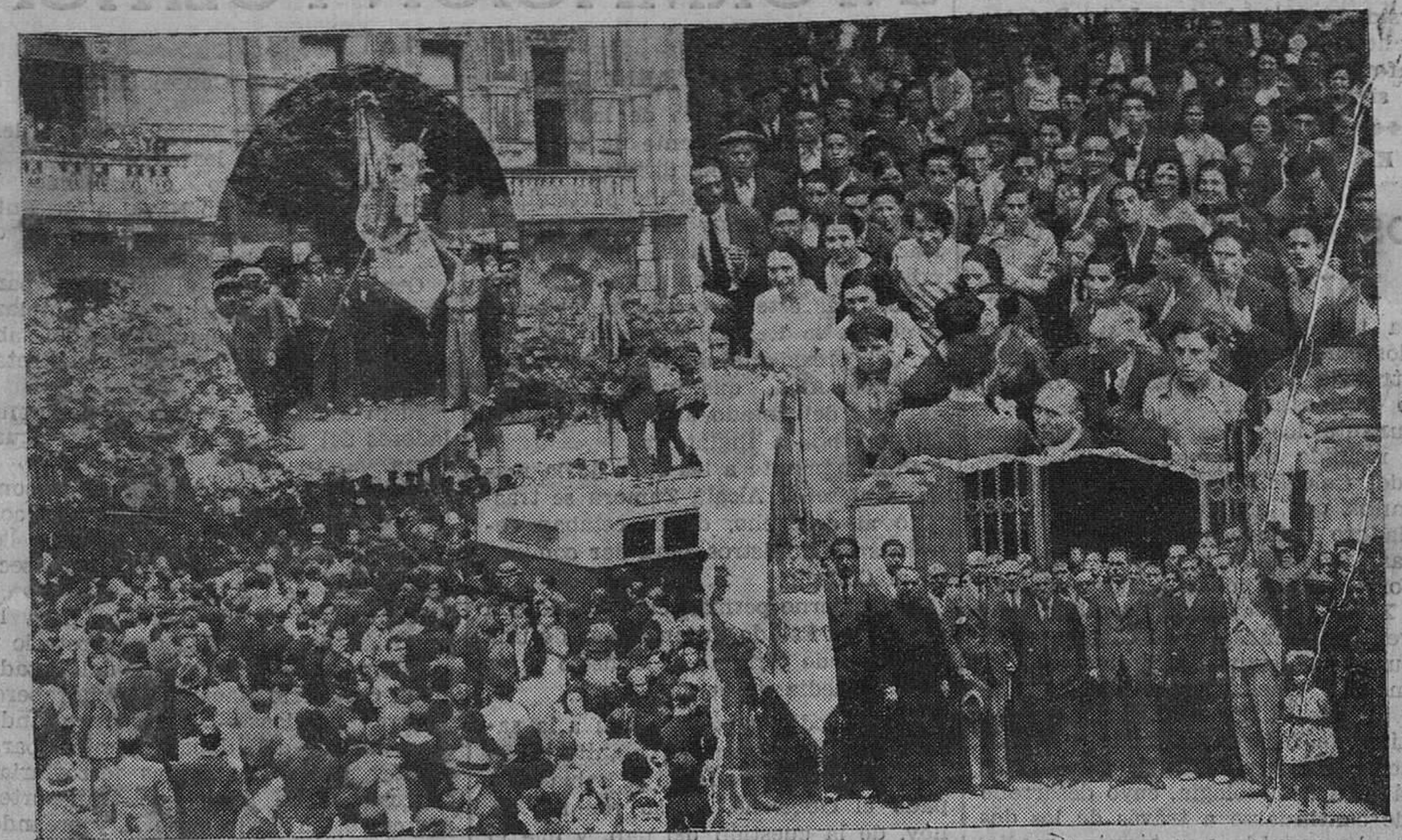
LA CORAL DE VALLADOLID, EN SANTANDER. — La notable agrupación al llegar al Ayuntamiento, donde fué cariñosamente recibida. — Las autoridades y representantes de Valladolid y Santander, a la puerta del Ayuntamiento, después de la recepción. — Las banderas de las agrupaciones se saludan, mientras el público prorrumpe en una calurosa ovación.