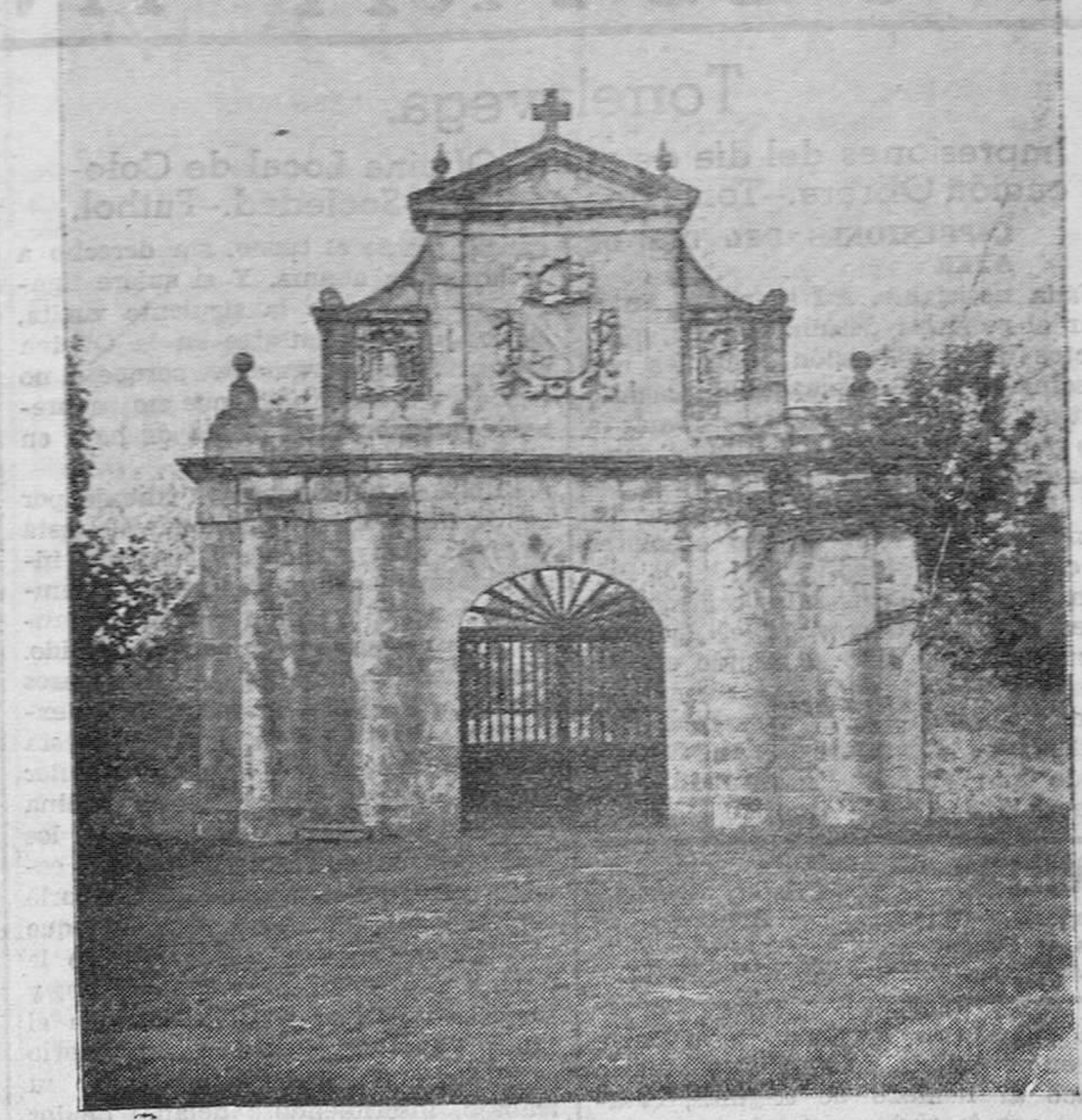
RINCONES DE LA MONTANA. — Portalada en Entrambasaguas.

ESPECTACULOS TEATRO PEREDA.—A las 7 y 10'30, «La máscara de Fu Manchú» y complementos de actualidad sobre el traslado de los restos de Blasco Ibañez a Valencia. COLISEVM.—A las 7'15 y 10'30, estreno, «Hombres de leyes». GRAN CINEMA.—«Actualidades». FABELLON NARBON.—De 8'30 a 10'30, «De cara al cielo», por Spence Tracy y Marion Nixon. SALON VICTORIA.—7 y 10'30, George Milton en «Por un beso». POPULAR VICTORIA.—De 6'30 a 10'30, la graciosísima producción de George Milton «Por un beso». SALA NARBON.—7 y 10'30, Grace Moore en la producción Metro «Música de besos». Butaca: tarde, 0'50; noche, 0'40. Equipo sonoro Rivaton. CINE FRONTON.—Sección continua de 6'30 a 9'30, la interesante producción de Artistas Asociados «Tras la máscara», y reportaje sobre el traslado de los restos de Blasco Ibañez a Valencia. CINEMA DE BONFAZ.—A las 5'30 y 7'30, la película «Órdenes secretas». En la sección de las cuatro se regalarán cuentos a los niños. Precio, 0'50. La sección de las 7'15, a beneficio de los Estudiantes Católicos: 0'75 y 1.