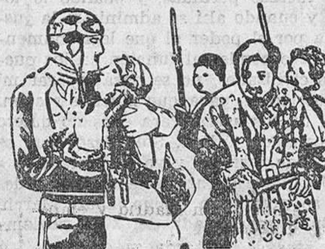
El responsable de guerra por Jack Holt y Ralph Graves.

ESTRENO de la sensacional producción COLUMBIA, repleta de acción y emotividad