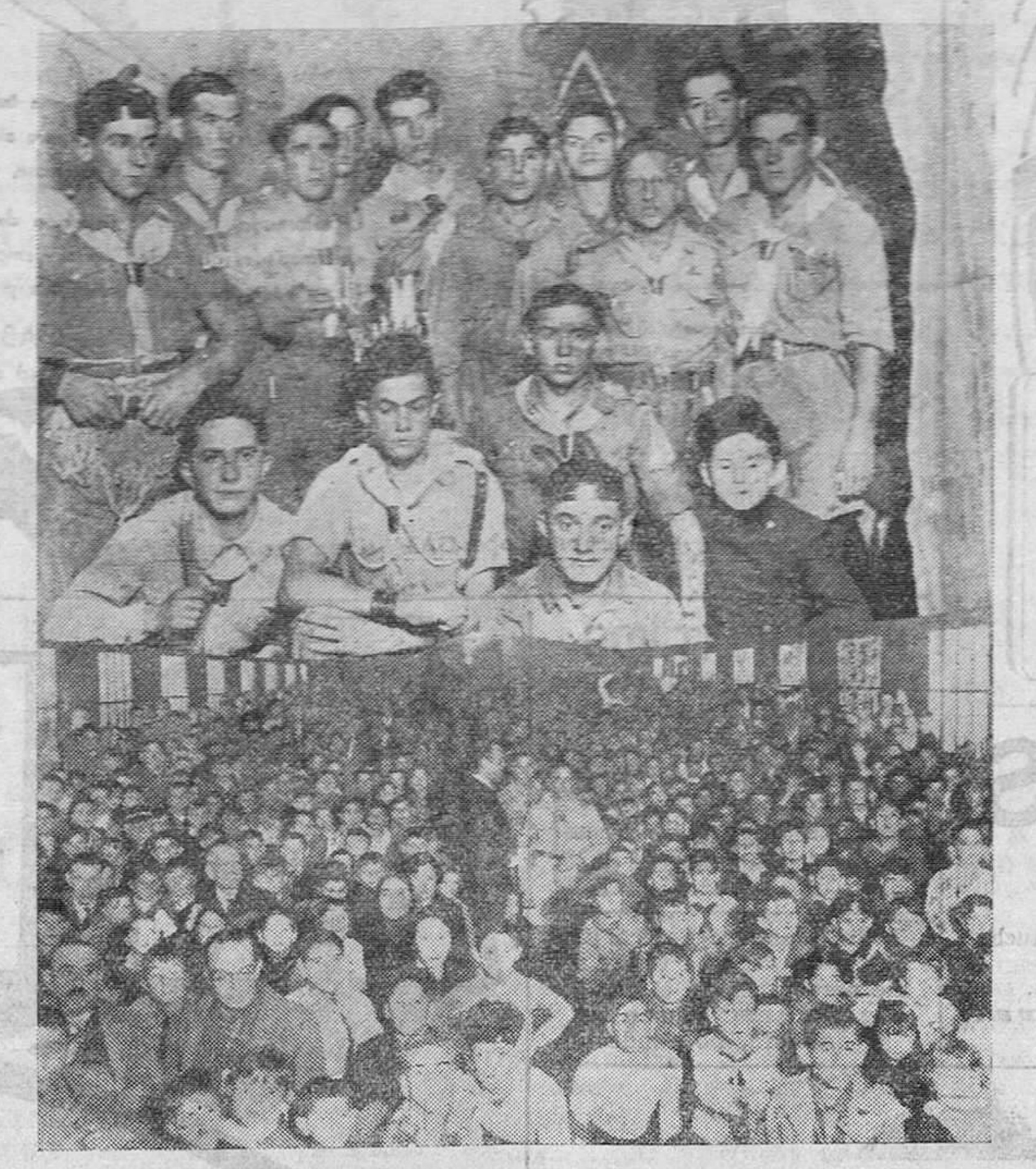
LA FIESTA DE LOS EXPLORADORES. — Simpatícos «boy-scouts» que asistieron al festival infantil celebrado en la Feria de Muestras, el pasado domingo. La alegría y el compañerismo fueron las características de la fiesta.

Entre las fiestas y actos organizados durante estos días por la representación de los exploradores santanderinos, han figurado algunos que, por su importancia y significación, queremos recoger en nuestras columnas.