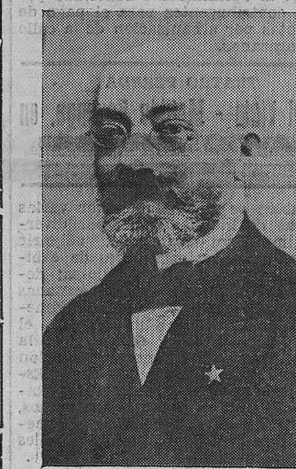
El doctor Luis L. Zamenhof, genial creador del idioma Esperanto, en cuyo honor se descubrirá hoy una lápida que dará nombre a una calle de esta ciudad, con motivo del X Congreso Nacional de la Sociedad Española Esperantista.

el salón de actos de la Feria de Muestras, se celebrará la sesión de apertura, habiendo prometido su asistencia los señores gobernador civil, presidente de la Diputación y alcalde. A la terminación del acto se descubrirá la lápida que dará el nombre a la nueva calle del Doctor Zamenhof, situada en la esquina de la de Jesús Monasterio, junto al Pabellón Narbón.