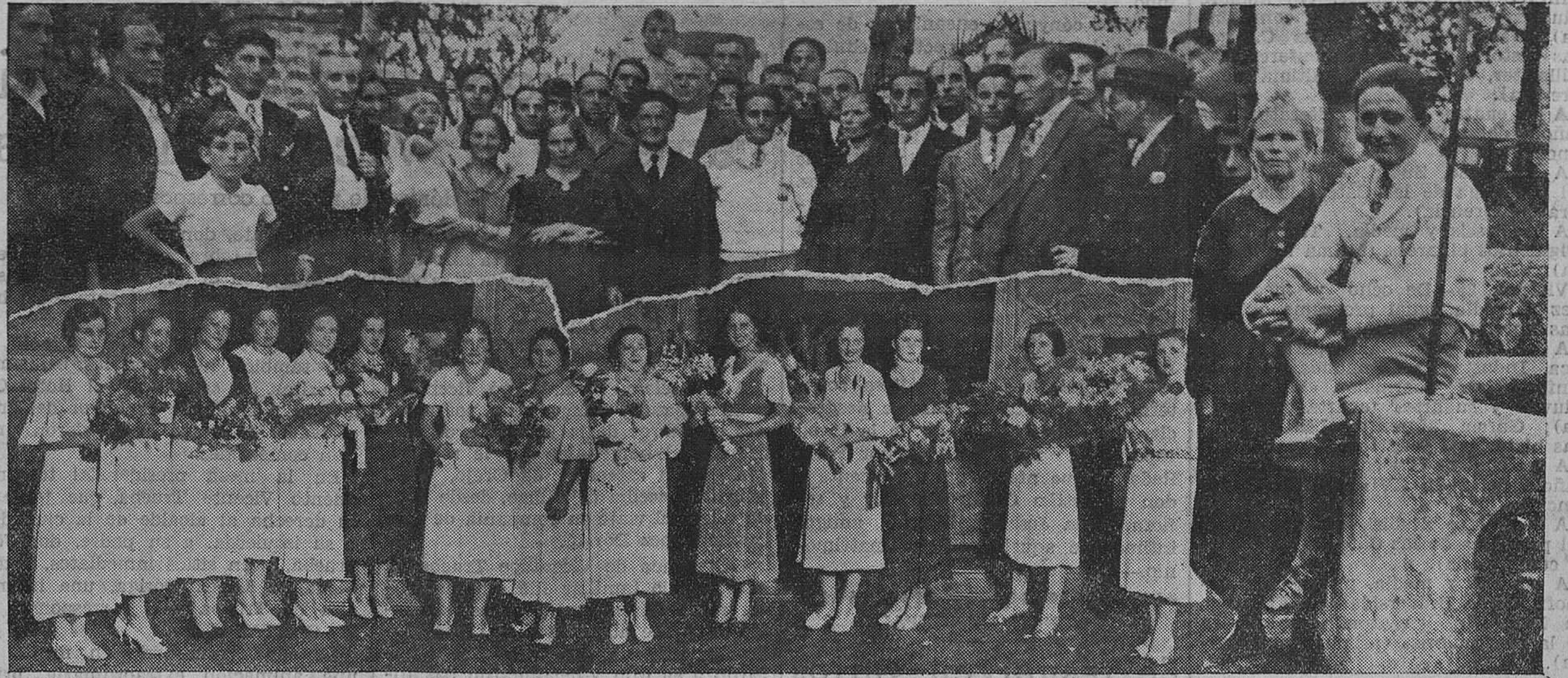
Vicente Trueba es cariñosamente recibido en Torrelavega. El gran corredor, en su casa de Torrelavega, rodeado de sus padres, hermanos y amigos. El grupo de bellísimas jóvenes que ofrecieron al gran corredor preciosos ramos de flores, en el Ayuntamiento de Torrelavega. — Vicente Trueba, con su madre, en el patio de su casaca.

Para limpiar, blanquear y conservar bien la ropa, use el jabón de lavar LA ROSARIO (Vea anuncio en la página 7.ª)