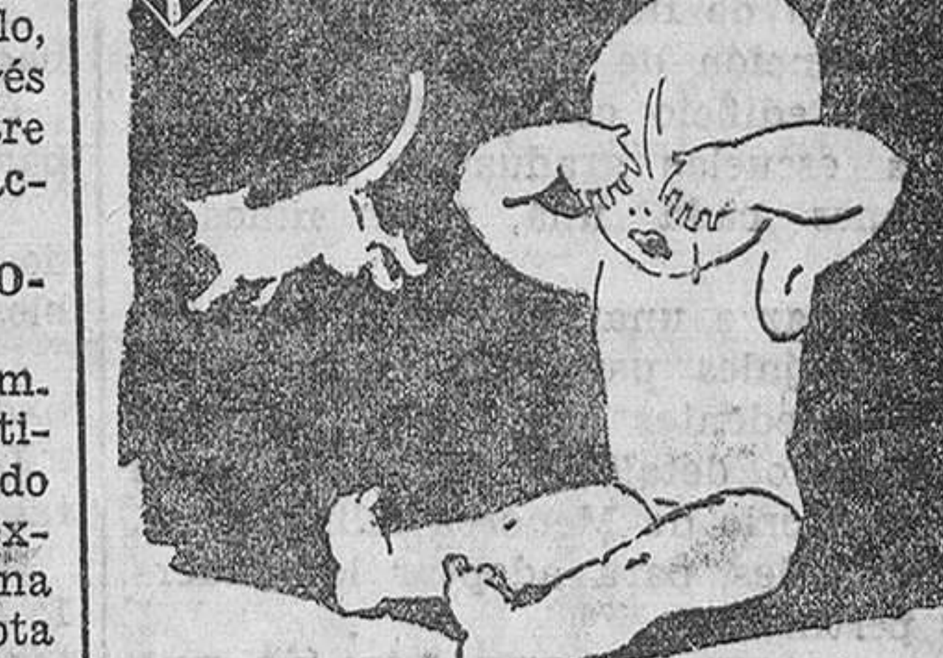
¿Le arañó el gato?..

Mañana, a las nueve y media de la noche, en el salón de actos de la Casa del Pueblo, se celebrará el beneficio-homenaje a las compañeras que integran este Cuadro Artístico, y que vienen, con todo interés y entusiasmo, prestando su colaboración personal, contribuyendo extraordinariamente a la labor cultural y educativa que viene realizando este conjunto de entusiasmas anexionados.