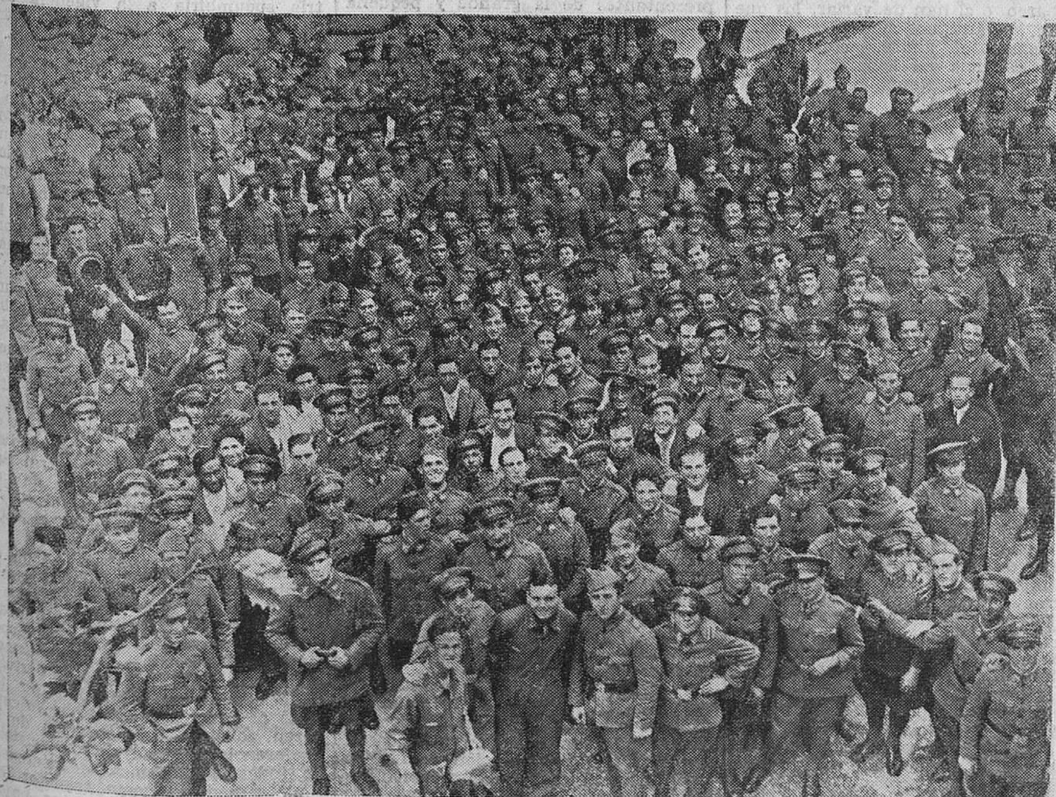
EN EL CUARTEL DE INFANTERIA. — Los reclutas del regimiento, en uno de los patios, después de cantar su himno en honor de los marinos franceses.