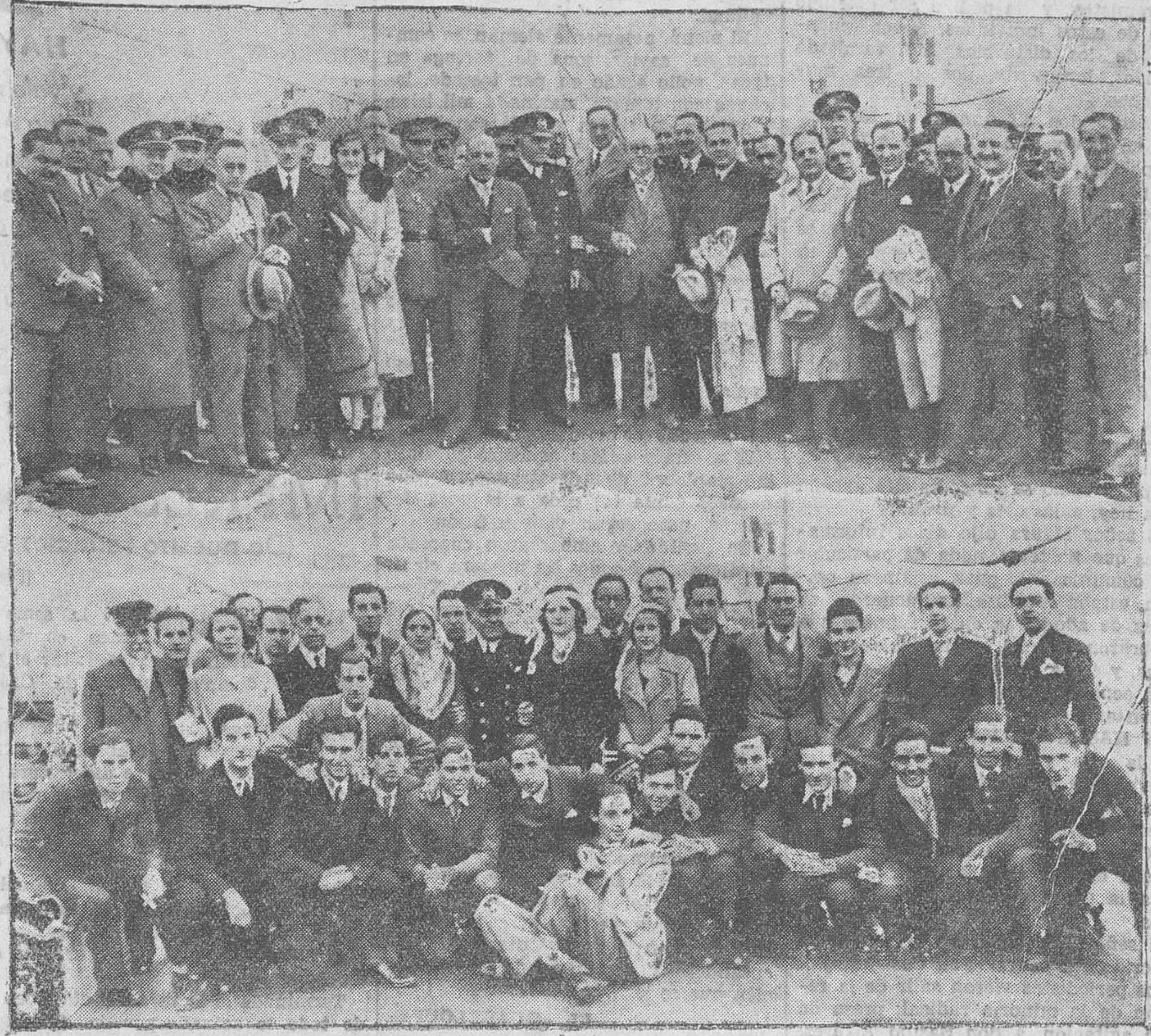
LA LLEGADA DEL «ORINOCO». — Grupo de invitados a la inauguración del servicio Santander-América, a bordo del motonave «Orinoco». — En la parte inferior, los alumnos de alemán de la Escuela de Comercio con el capitán del barco.

Un grupo levantino recorrió las calles en manifestación, sin que se registraran incidentes.