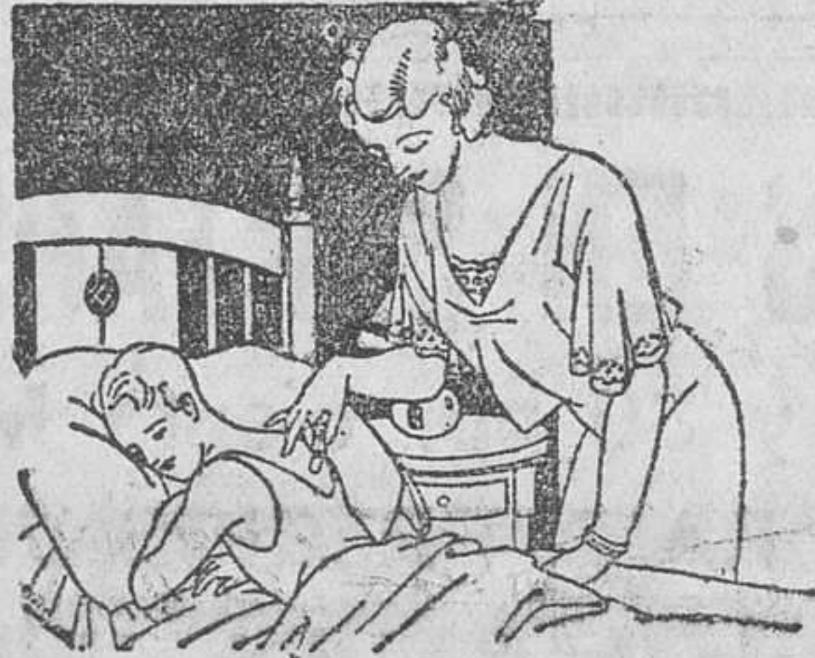
Resfriados - Asma - Pleuresias Congestión pulmonar