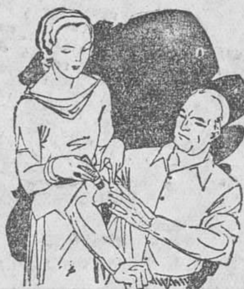
Dolor en las articulaciones Calambres

No ocupa sitio Descongiona sin irritar No ensucia No tiene mal olor