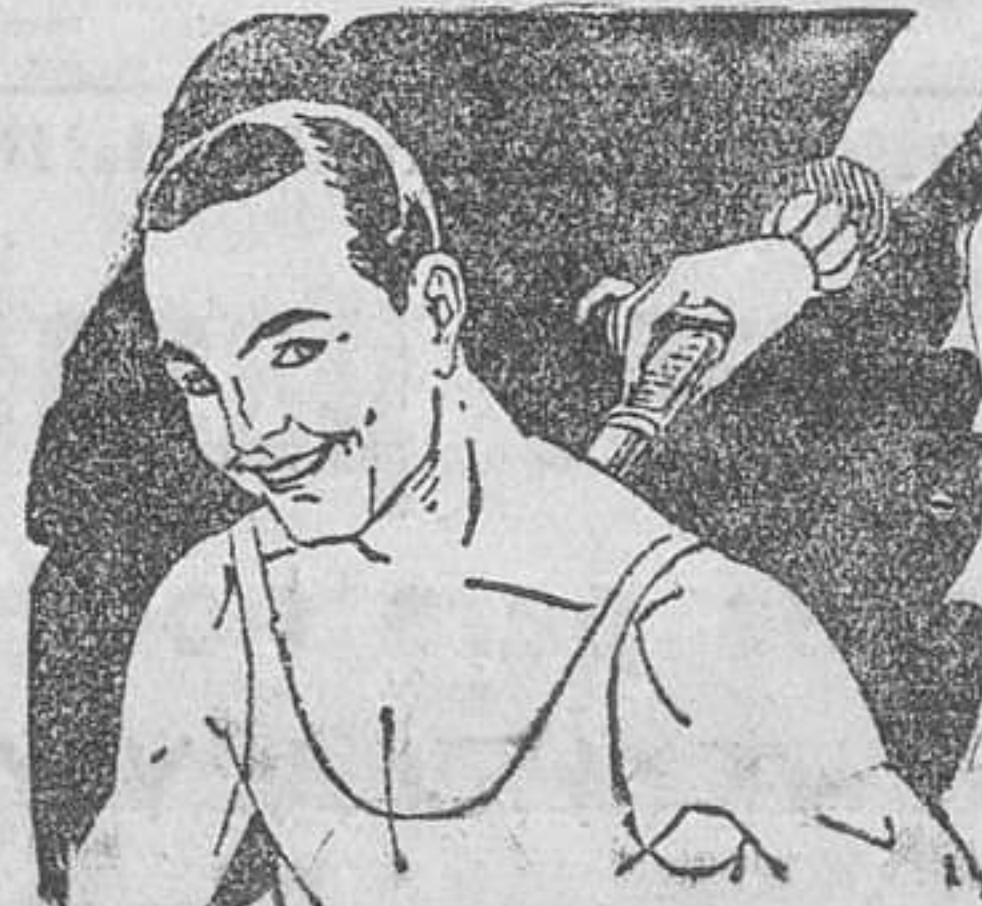
Rigidez del cuello Torticollis