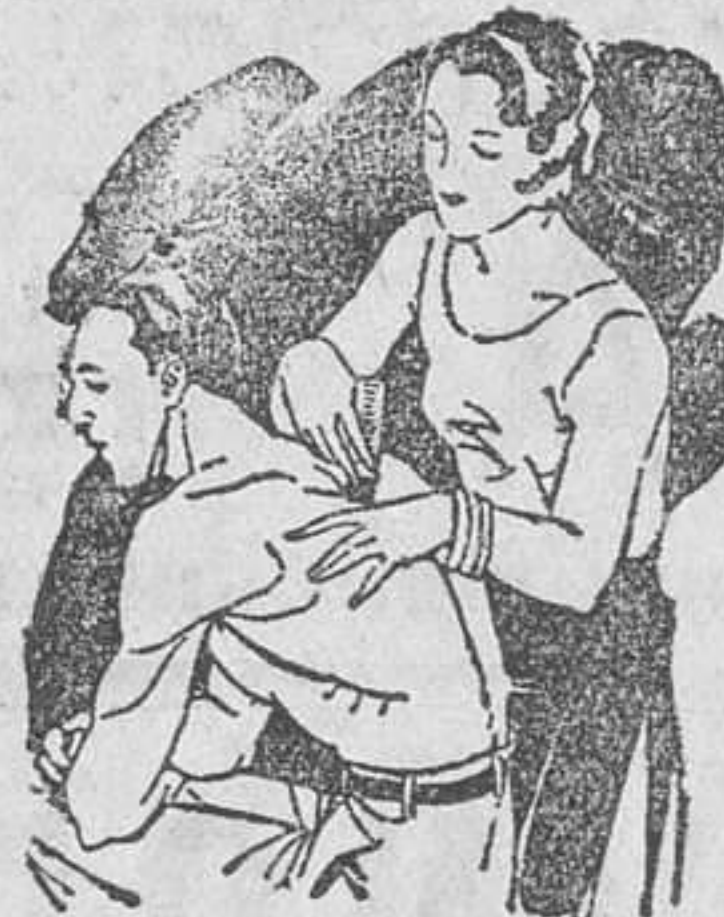
Artrismo Dolores de muñeca y brazos Dolores de espalda y riñones

El LAPIZ TERMOSAN se vende en todas las Farmacias y Centros de Específicos Tubo grande; 4.45 ptas. - Tubo pequeño; 3.- ptas., timbres incluidos