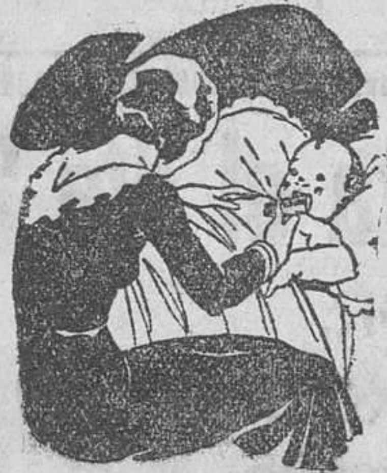
Tos - Catarros - Bronquitis Congestiones