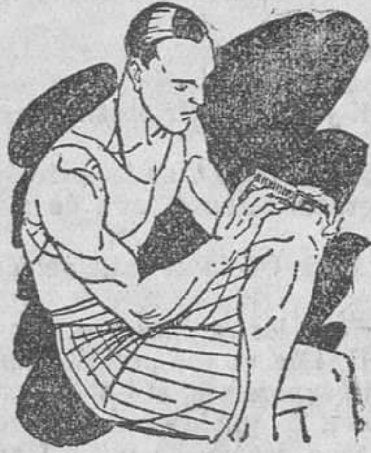
Reuma - Clática Golpes

Preparado en forma de una barrita de facilísimo empleo. Se aplica rápidamente tal como se presenta y sin tener que ensuciar-se las manos.