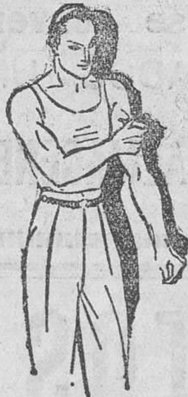
Fatiga muscular Golpes-Torceduras