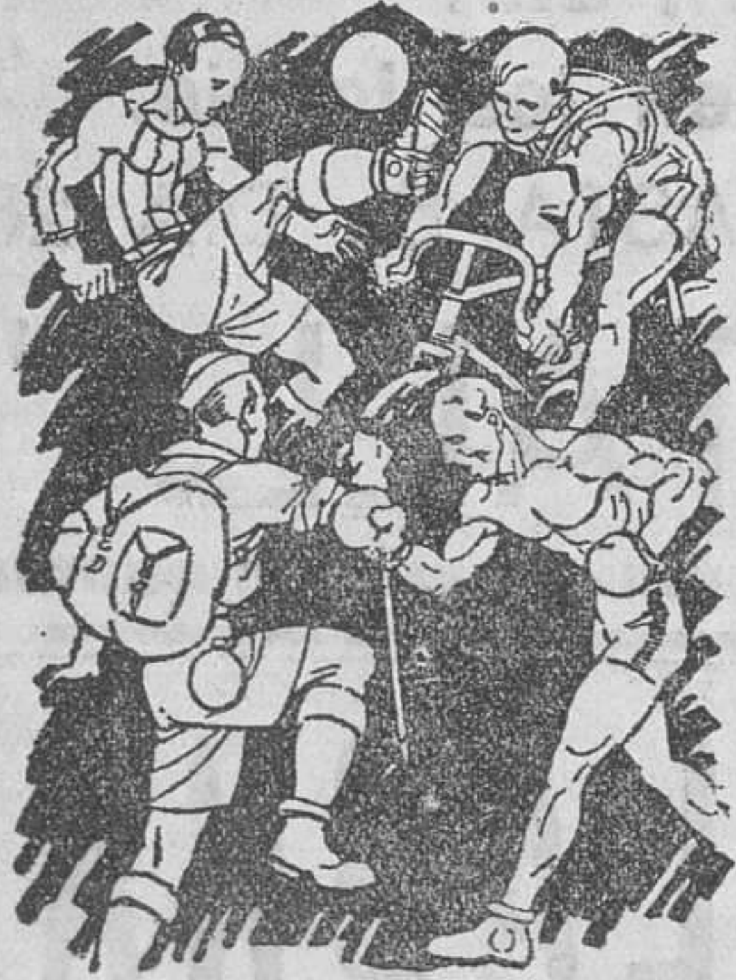
Indispensable para toda clase de sports. No ocupa sitio ni es frágil