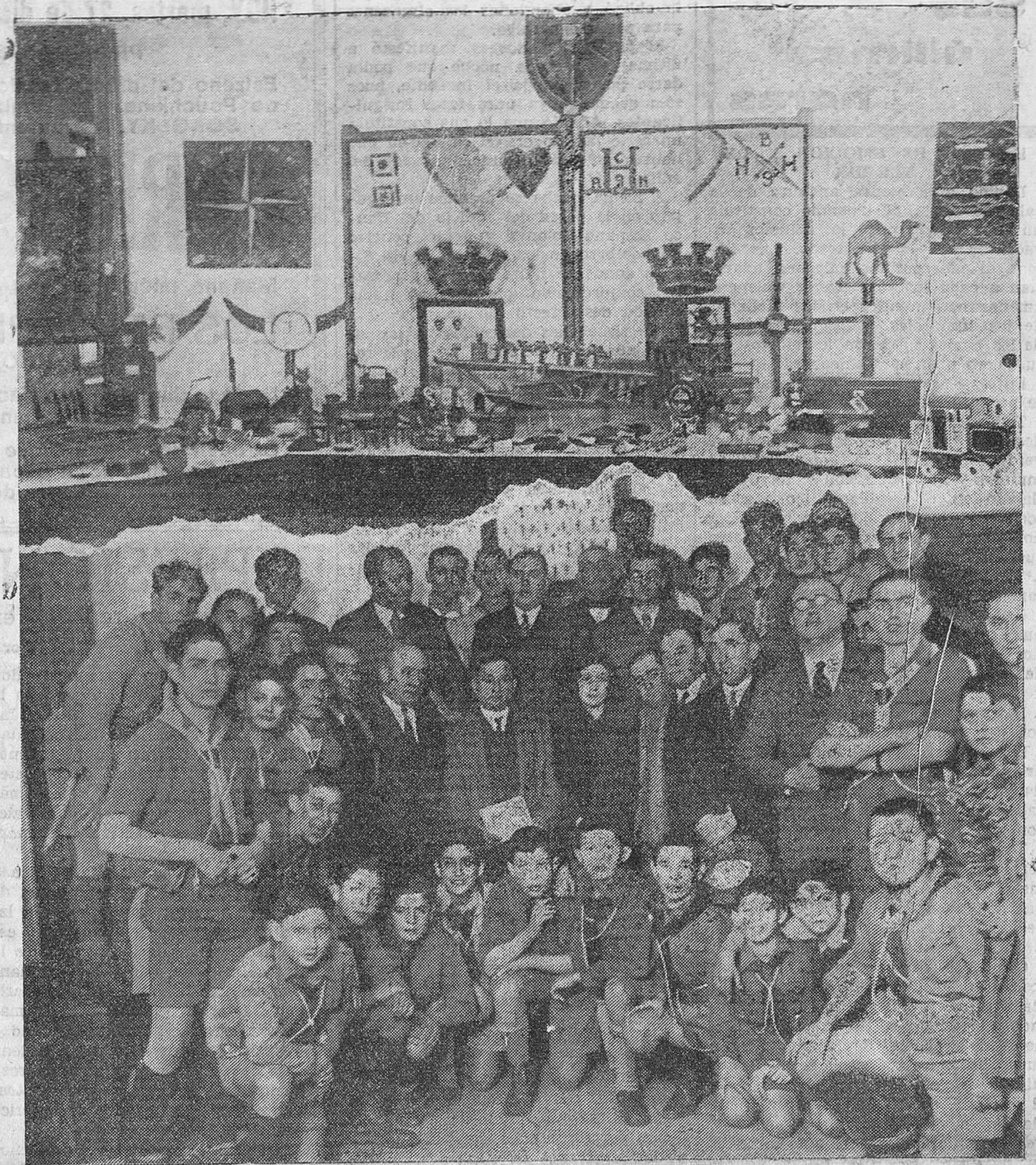
LOS EXPLORADORES SANTANDERINOS. — El domingo se ha inaugurado una exposición notabilísima de trabajos realizados por los jóvenes exploradores santanderinos, que el fotógrafo ha sorprendido en unión de sus jefes, algunos maestros nacionales y concejales del Ayuntamiento de la ciudad. La exposición ha sido muy elogiada, y será visitadísima en estos días de Pascuas por todos los amantes a las cosas curiosas.

Leopoldo Rodríguez P. Sierra MÉDICO RADIÓLOGO Especialista en Piel, Secreter y Radiumterapia. Consulta de diez a una. -Muelle, 20. -Tel. 25-38.