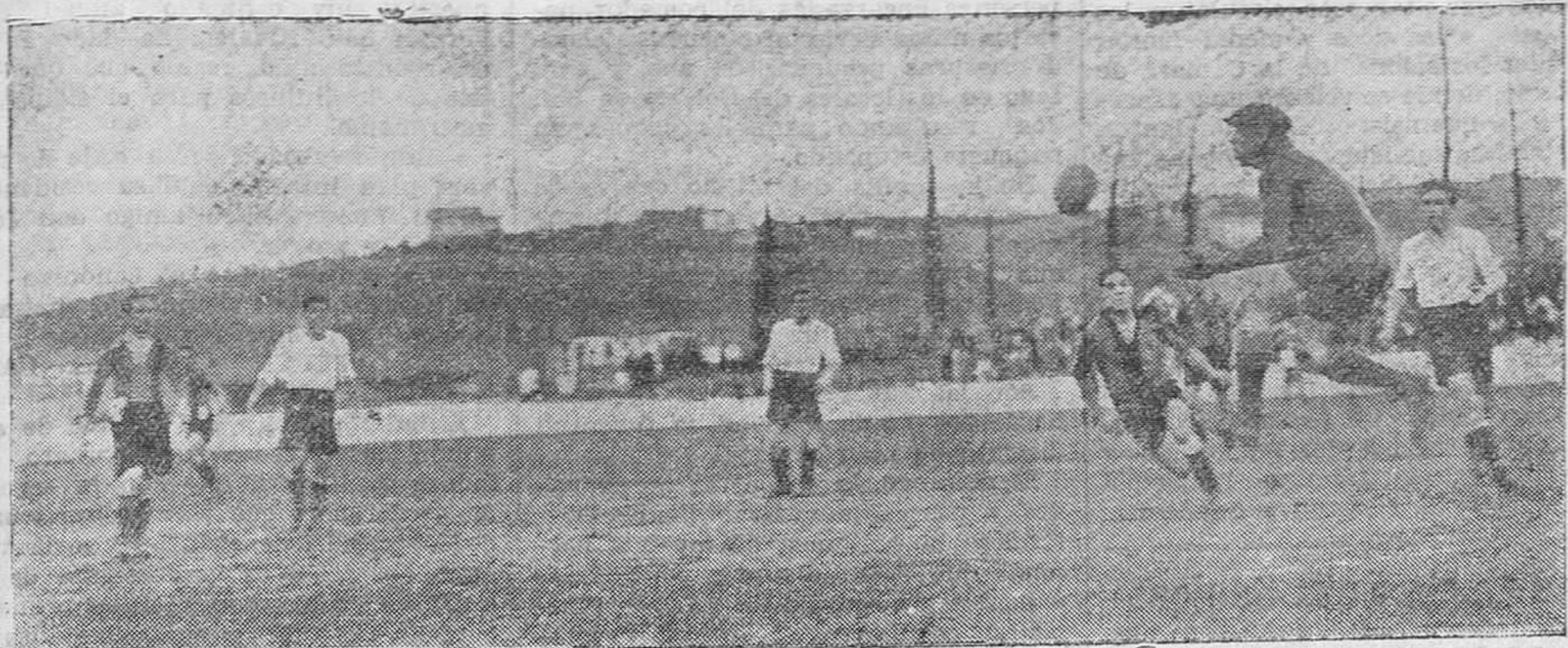
DEL PARTIDO ARENAS-RACING. — En un momento de peligro para la meta racinguista, Solá sale a parar un balón.