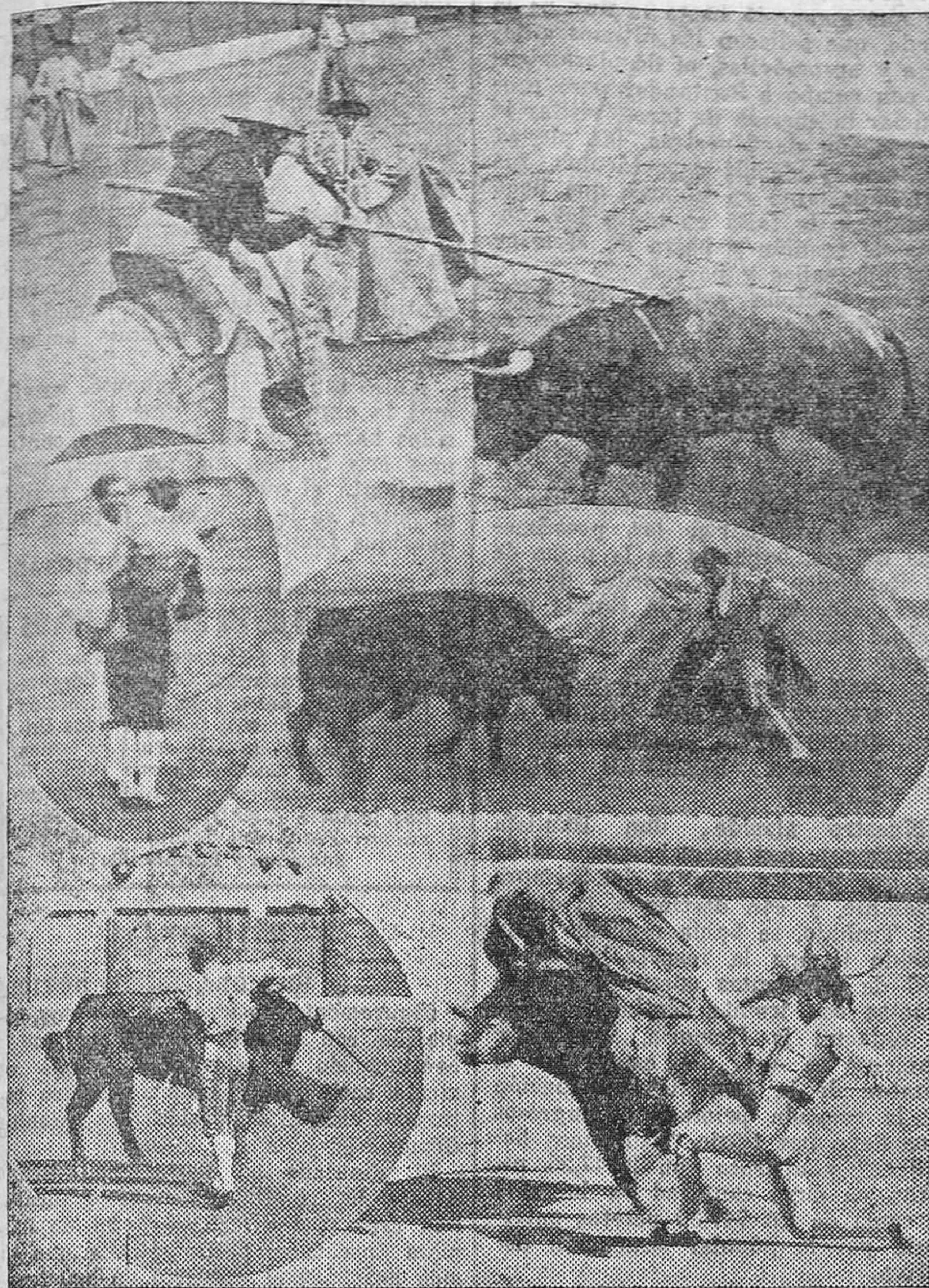
NOTAS GRAFICAS DE LA CORRIDA DEL DOMINGO. — Lalanda, en el momento de dar la alternativa a Maravilla. — Marcial, en un lance de frente por detrás. — Bienvenida, en la faena al tercer toro, del que cortó la oreja. — Un magnífico pase, rodilla en tierra, de Maravilla. — Arriba, el ignominioso episodio del puyazo, que deshizo materialmente al segundo toro. La foto tiene el valor de documento histórico para mostrar la manera alevosa, bárbara y antitaurina de ejecutarse hoy la suerte de varas.

Cuatro de Pérez Tabernero y cuatro de Angoso, para Lalanda, Bienvenida, Solórzano y Maravilla.