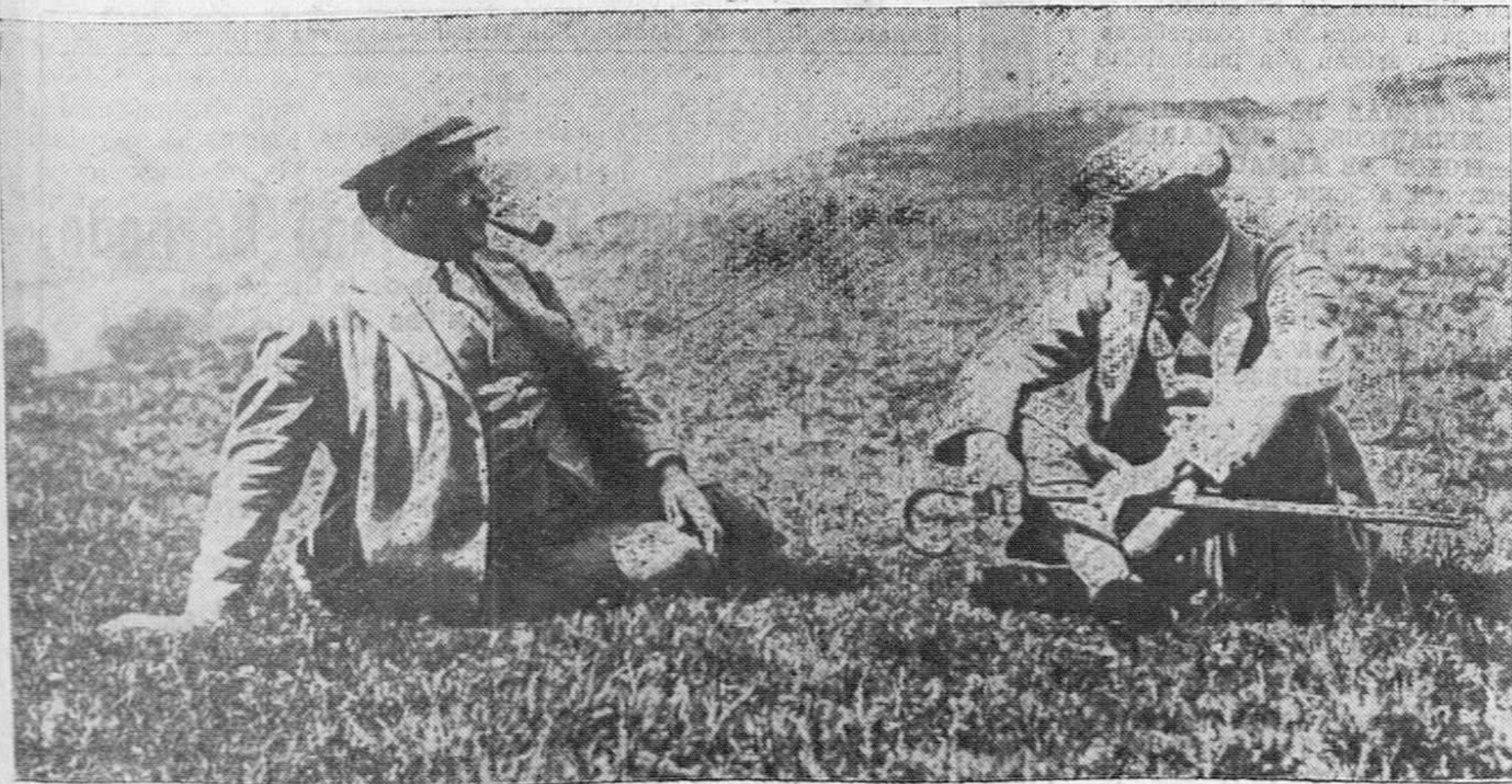
He aquí una curiosa fotografía de Herriot y Macdonald, presidentes de los Gobiernos de Francia e Inglaterra, respectivamente, obtenida sobre el monte Gymbeline, en Chequers, con motivo del último viaje de Ramsay Macdonald a París.

Tales motivos son los que nos han movido a escribir estas líneas, llamando la atención de los diputados, en defensa de los intereses generales de muchos pueblos de la montaña.