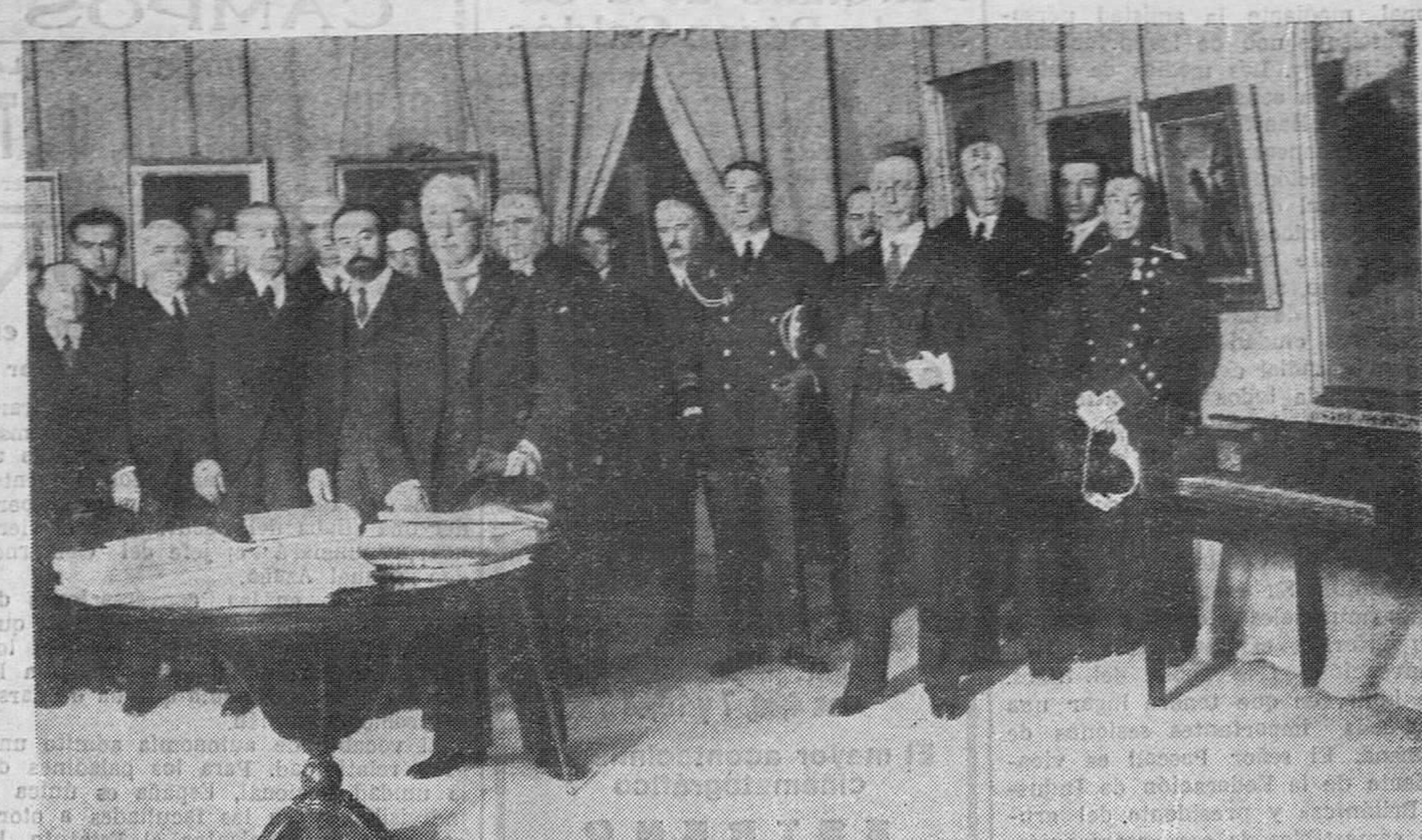
EN UNA EXPOSICIÓN. — El presidente de la República, con el ministro de Instrucción pública, inspeccionando la Exposición de Influencia de Goya en la pintura española, organizada por la Asociación de Amigos del Arte, de Madrid.