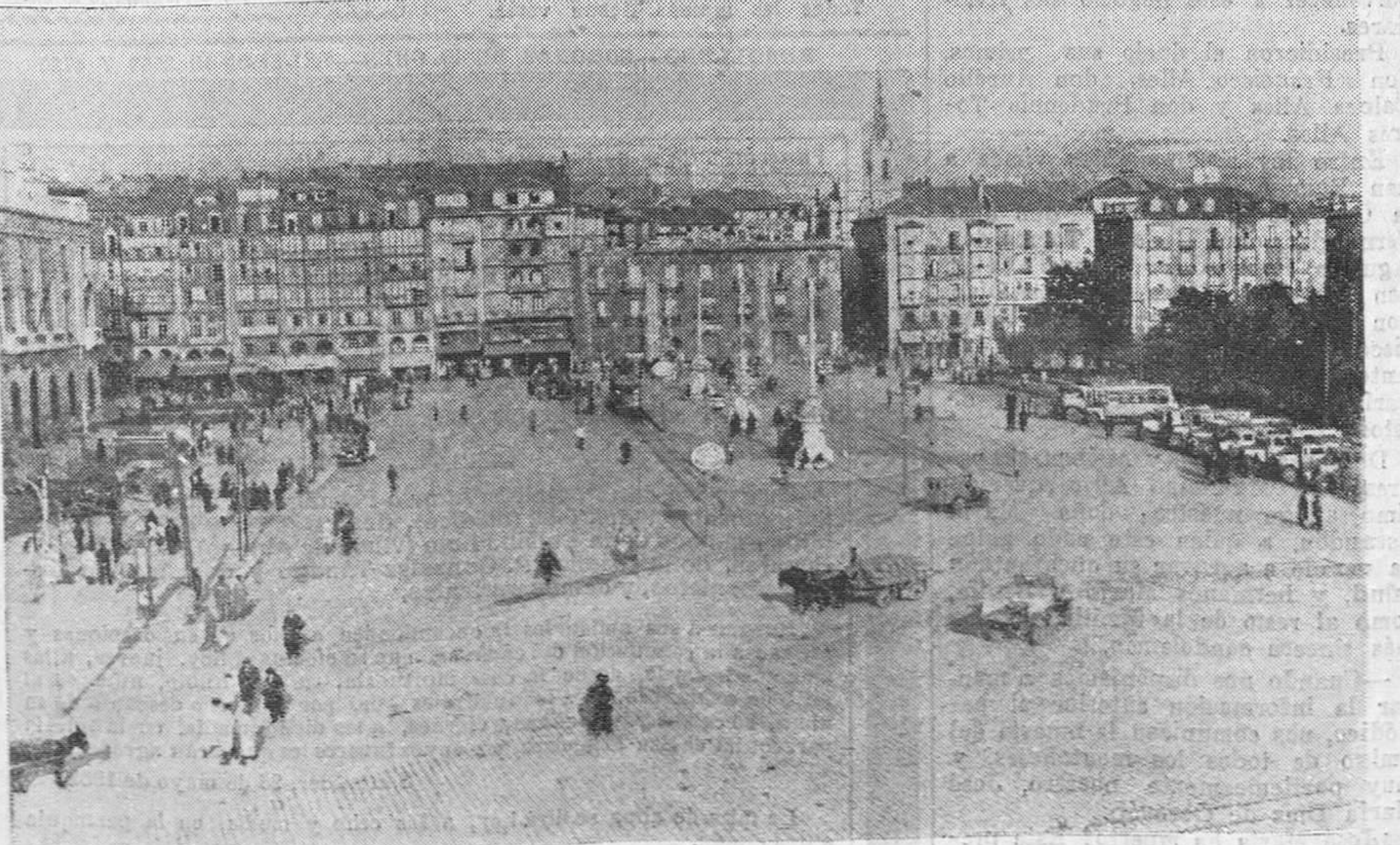
LA HUELGA DE TAXIS. — Aspecto de la avenida de Galán y García Hernández sin los taxis que la pueblan de ordinario.