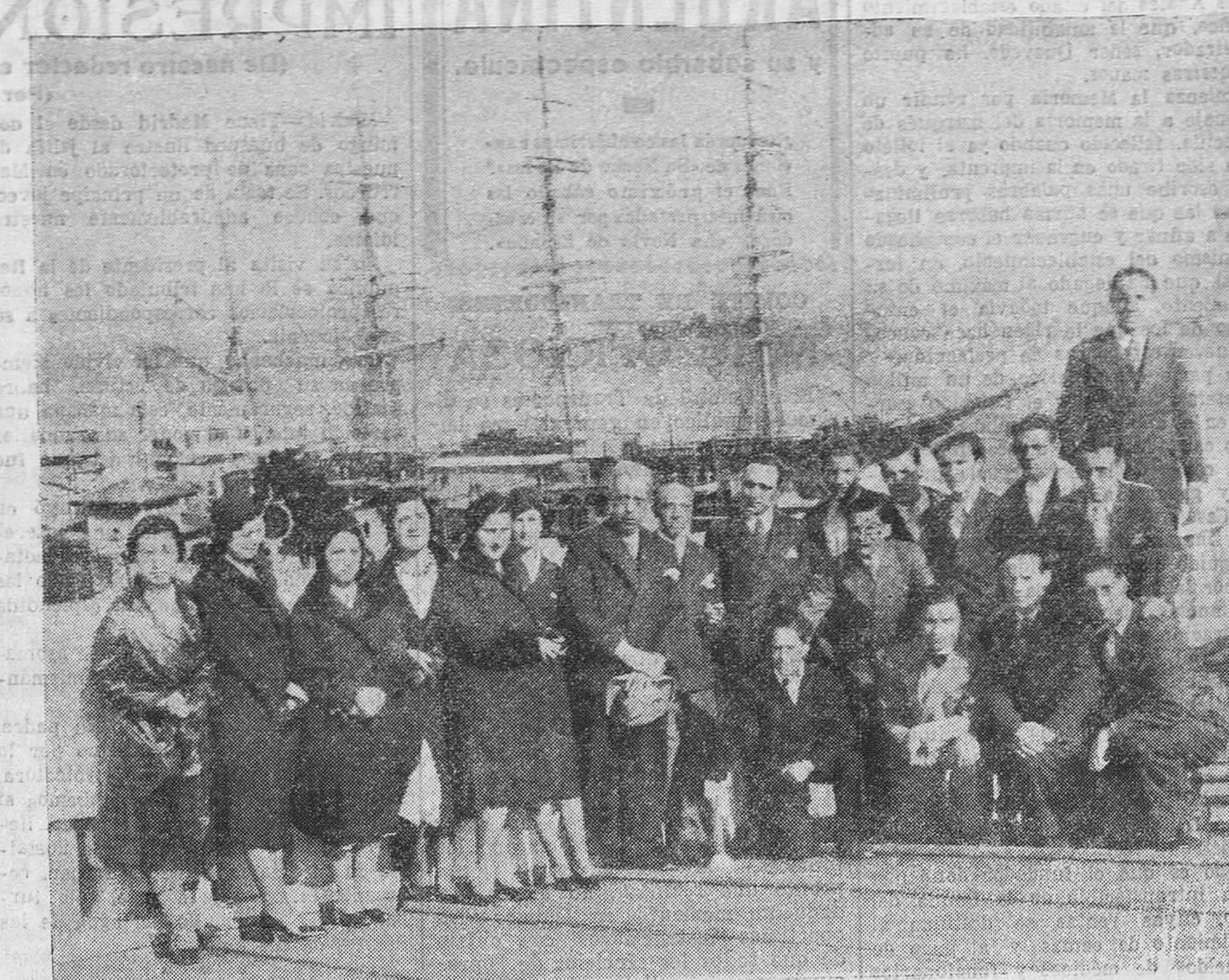
LOS PERITOS MERCANTILES, EN EL BANCO DE ESPAÑA. — Los alumnos de las clases de conjunto de la Escuela de Comercio, que han terminado la carrera de peritos mercantiles, en la terraza de aquel centro bancario, con el director del mismo y los catedráticos señores Valladares y Aldasoro.

MEDICINA GENERAL ESPECIALISTA EN TUBERCULOSIS PULMONAR Y ENFERMEDADES DEL CORAZON Consulta de 10 1/2 a 1 y de 3 a 5. Gratis pobres, martes y sábados, 5 a 6. Burgos, 3, principal.—Teléfono 2924.