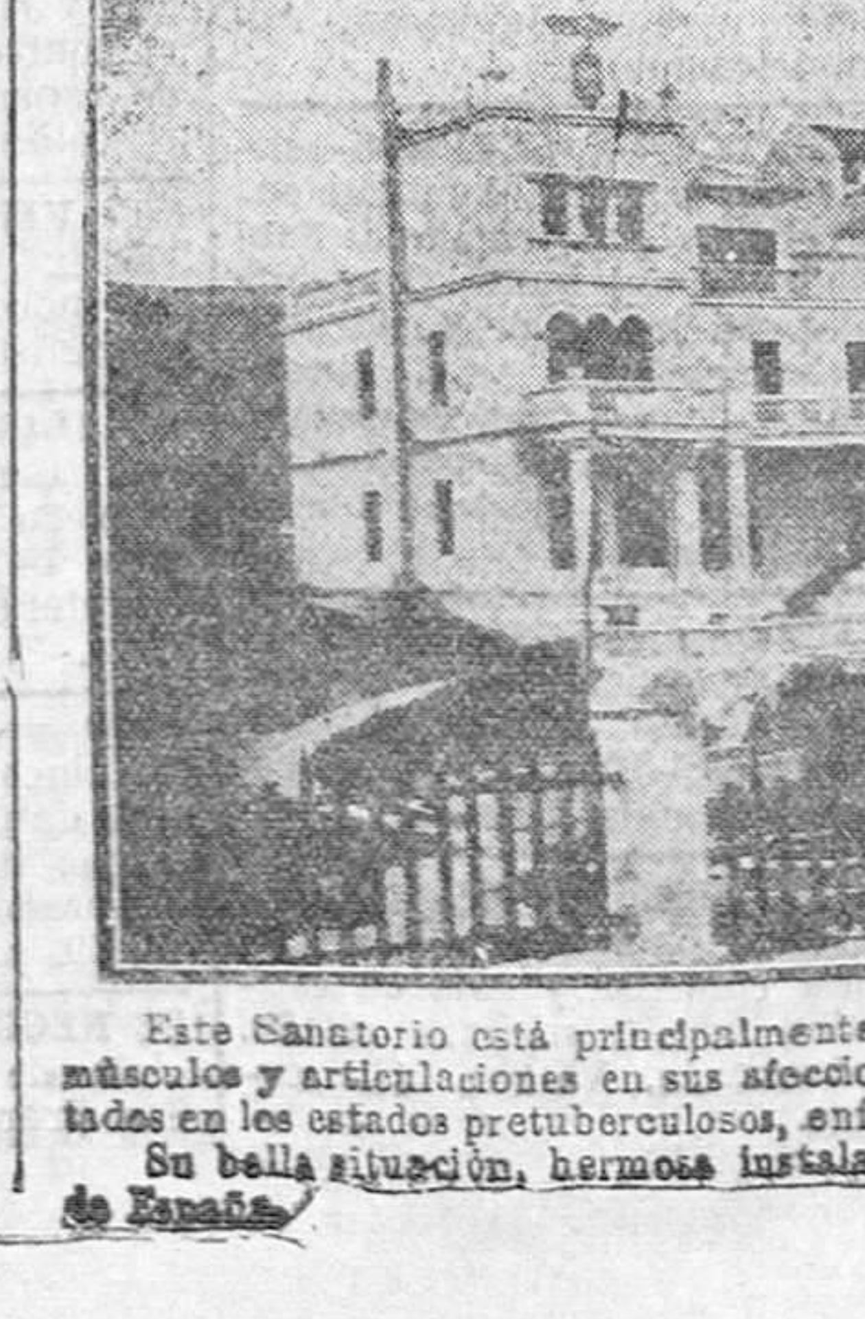
Este Sanatorio está principalmente destinado a las enfermedades de los huesos, músculos y articulaciones en sus afecciones tuberculosas, siendo de inmejorable resultado en los estados pretuberculosos, enfermedades de la nutrición, raquitismo, etc., etc. Su bella situación, hermosa instalación y confort le hacen ser uno de los mejores de España.

SARDINERO-SANTANDER Teléfono 2675 Médico-director: DON JESUS MATA RUNAYOR