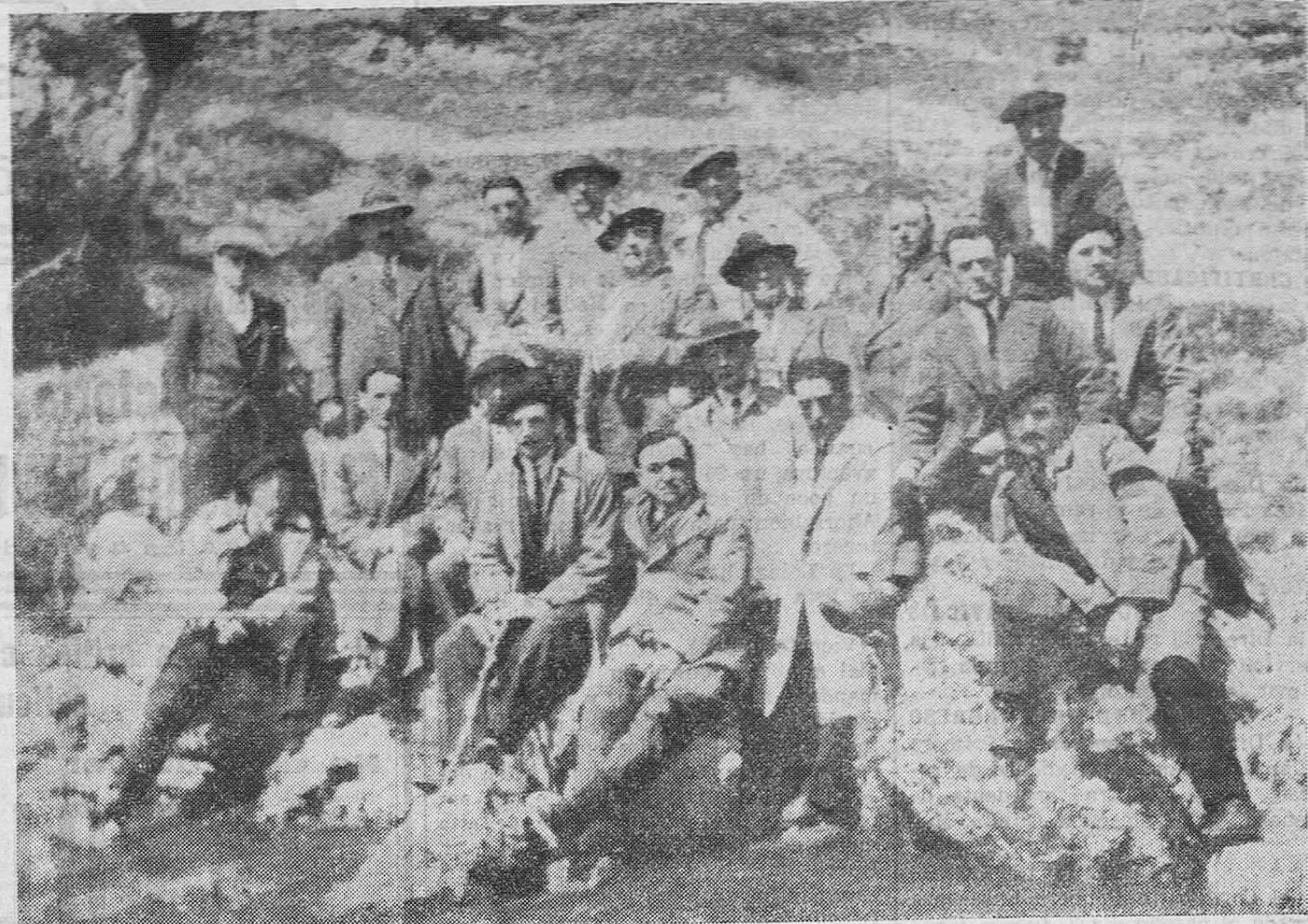
Grupo de santanderinos que el domingo, Primero de Mayo, realizaron una magnífica excursión a Taja-Riello, deteniéndose después en el pintoresco nacimiento del Ebro, en el corazón del gran valle de Campoo, que ofrece tantas maravillas al viajero.