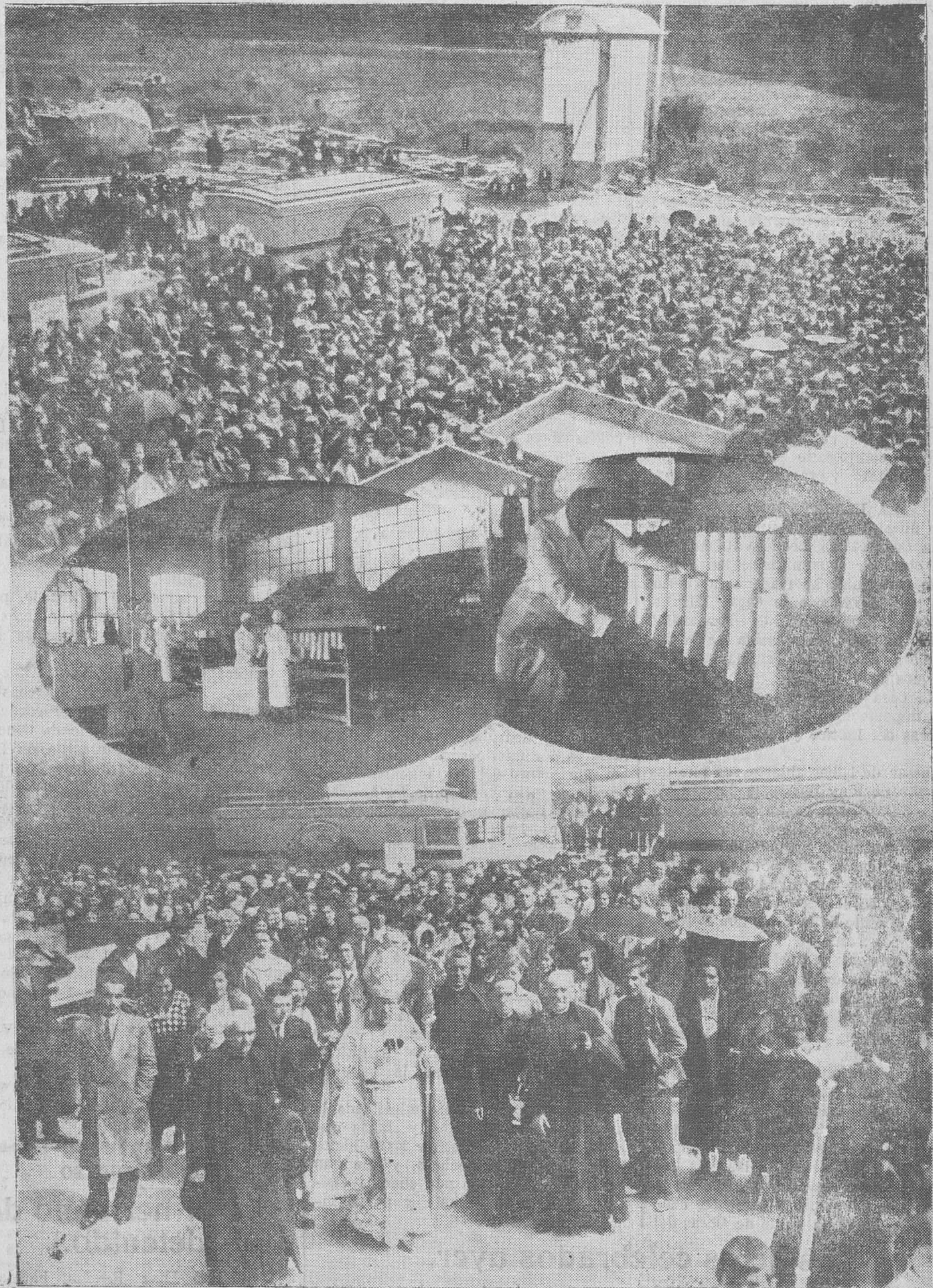
LA INAUGURACION DE LA COOPERATIVA LECHERA. — En la parte superior, el público escuchando el discurso del prelado. — Al centro, dos detalles de la fabricación y precintado de los envases de papel, y abajo, el obispo dirigiéndose a bendecir los edificios.

módo de viseras protectoras, unas atrevidas y airozas marquesinas de cemento, de perfil parabólico, que cubren bajo sus alas protectoras el patio de recepción de leche, todo él de sillería pulimentada o mármol natural, con pavimento inalterable impermeable y estanco, formado de piedras de ofita, de dureza comparable a la del acero, y con la particularidad, muy digna de hacerse notar, de que a las horas de trabajo, o sea las de recepción y preparación de la leche, queda inundado con una lámina de agua de cinco centímetros, que hace materialmente imposible que pueda levantarse la más ligera partícula de polvo, asegurando desde este instante una rigurosa pulcritud, para evitar hasta el límite posible todo riesgo de contaminación de la leche, que tan propensa es a toda clase de alteración, y que, por desgracia para los consumidores, tienen que soportar, sin darse cuenta, muchos peligros que pueden ser evitados procediendo con rigor y escrupulo desde el origen de las instalaciones.