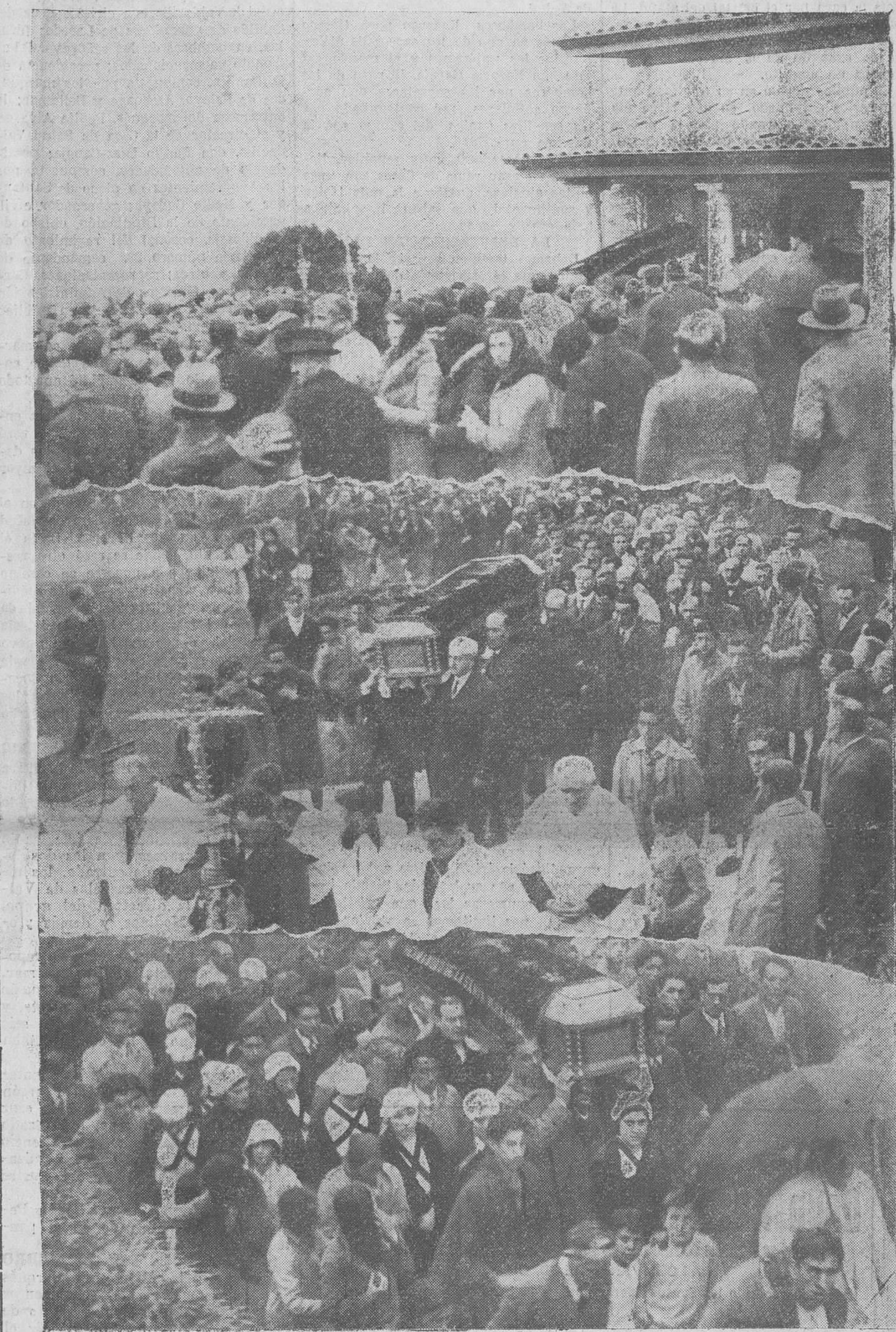
EL ENTIERRO DEL MARQUES DE VALDECILLA. — Momento de ser sacado de la capilla ardiente el féretro que contiene los restos del ilustre filántropo. — La cruz del Cabildo de Pescadores de Laredo, delante de la fúnebre comitiva, y la llegada al cementerio.

"Comparto el dolor originado por la muerte del hombre fuerte y bueno que fué generoso con su patria y con las Universidades españolas." La Liga de Contribuyentes envió el siguiente: