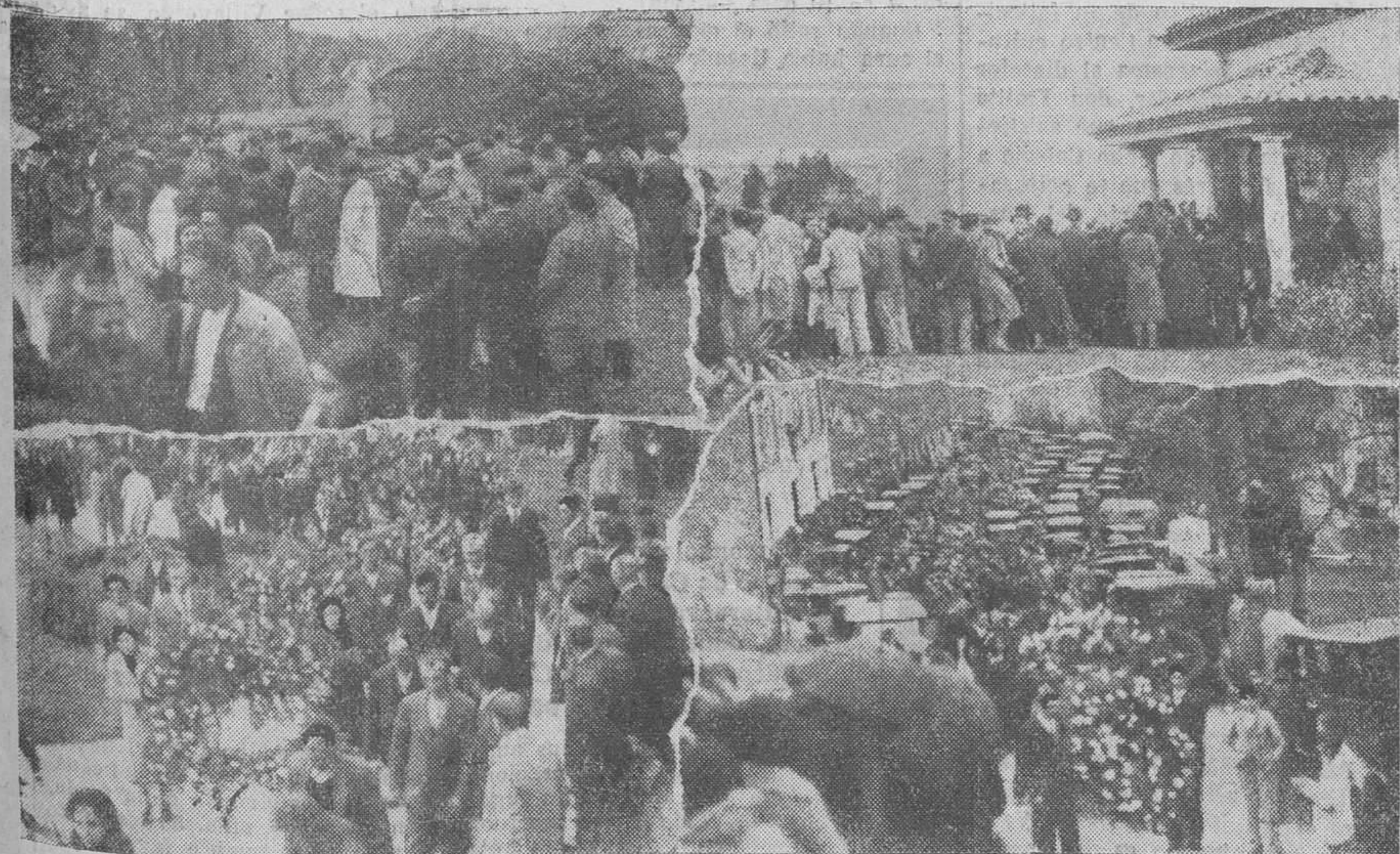
EL ENTIERRO DEL MARQUES DE VALDECILLA. — El público, dejando tarjeta y firmando en los pliegos colocados en "La Cabaña". — La capilla ardiente.— Grupos de coronas confeccionadas por la señora Viuda de Rebolledo, llevadas delante del cortejo fúnebre. — Aspecto del entierro ante el Ayuntamiento.

Los caminos de Valdecilla y la explanada del Ayuntamiento se llenaron en seguida de gentes de todas