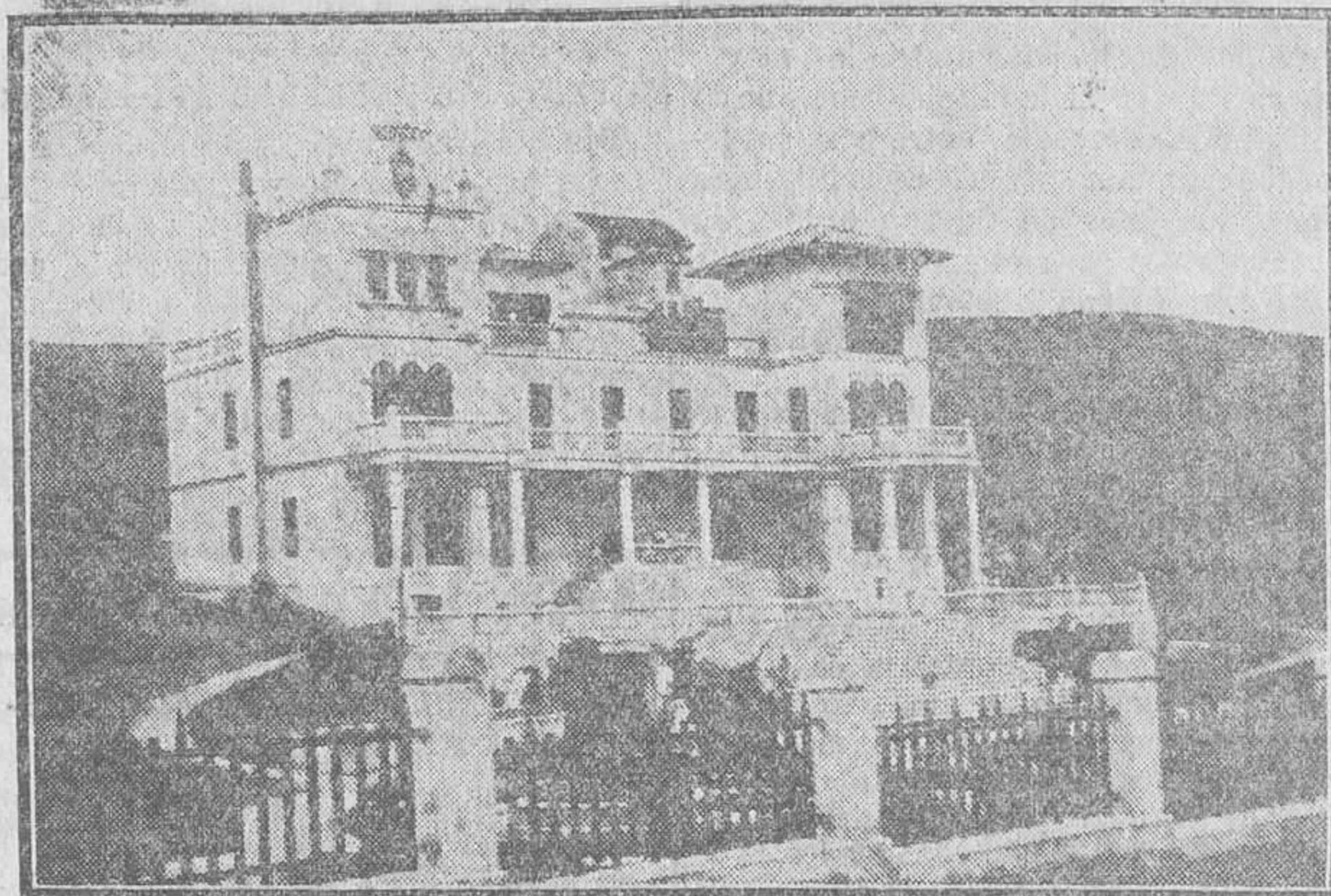
Este Sanatorio está principalmente destinado a las enfermedades de los huesos, músculos y articulaciones en sus afecciones tuberculosas, siendo de inmejorables resultados en los estados pretuberculosos, enfermedades de la nutrición, raquitismo, etc., etc. Su bella situación, hermosa instalación y confort le hacen ser uno de los mejores de España.