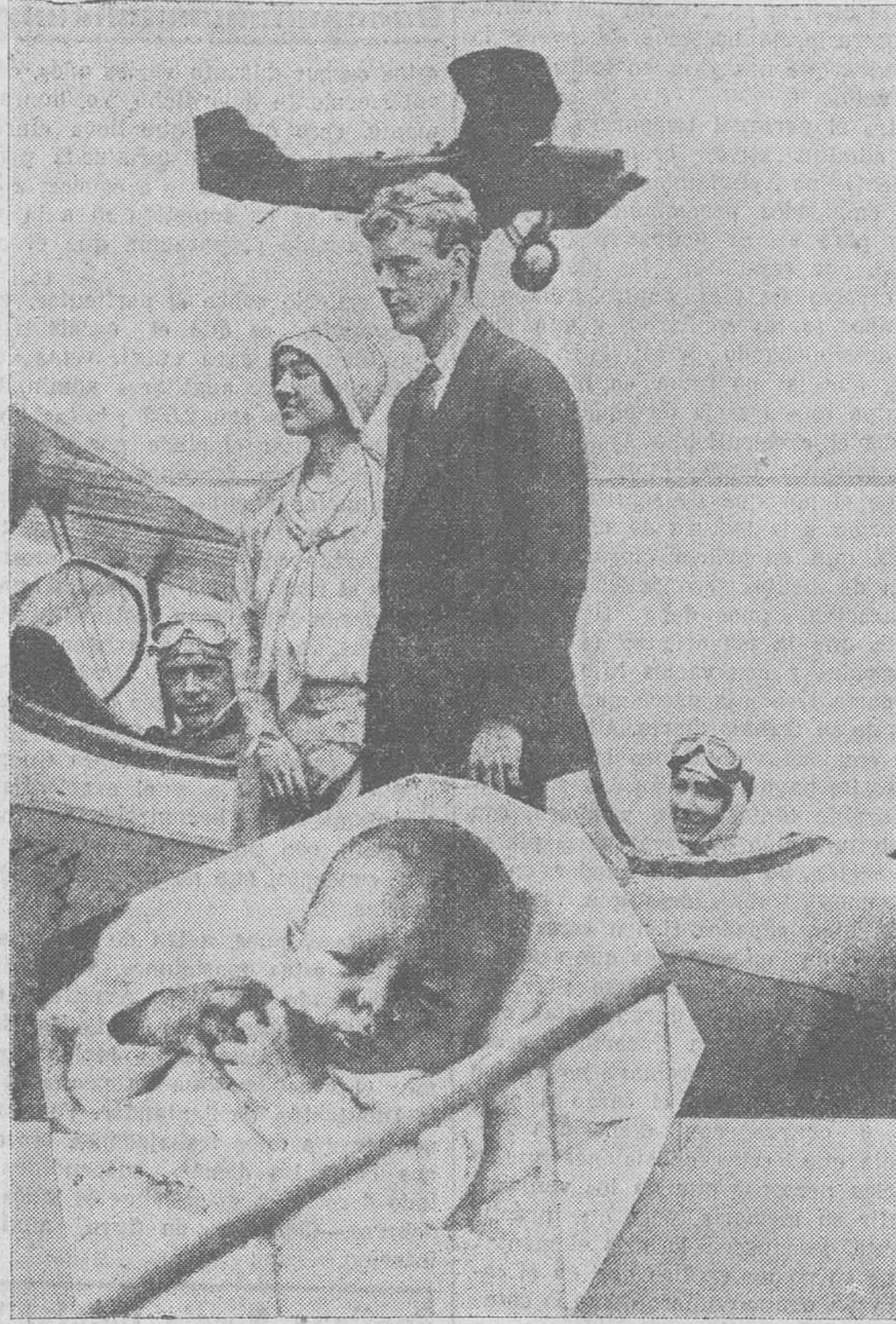
El famoso aviador americano Carlos Lindbergh y su esposa, la feliz pareja que tantos vuelos ha realizado, después de su enlace, y a la que unos audaces ladrones han robado a su hijo para exigirle un cuantioso rescate. Nuestra foto muestra al pequeño heredero de los Lindbergh, retratado cuando contaba pocos meses de edad y, por completo, ajeno a que, al llegar al año y medio, había de cotizarse tan alto.