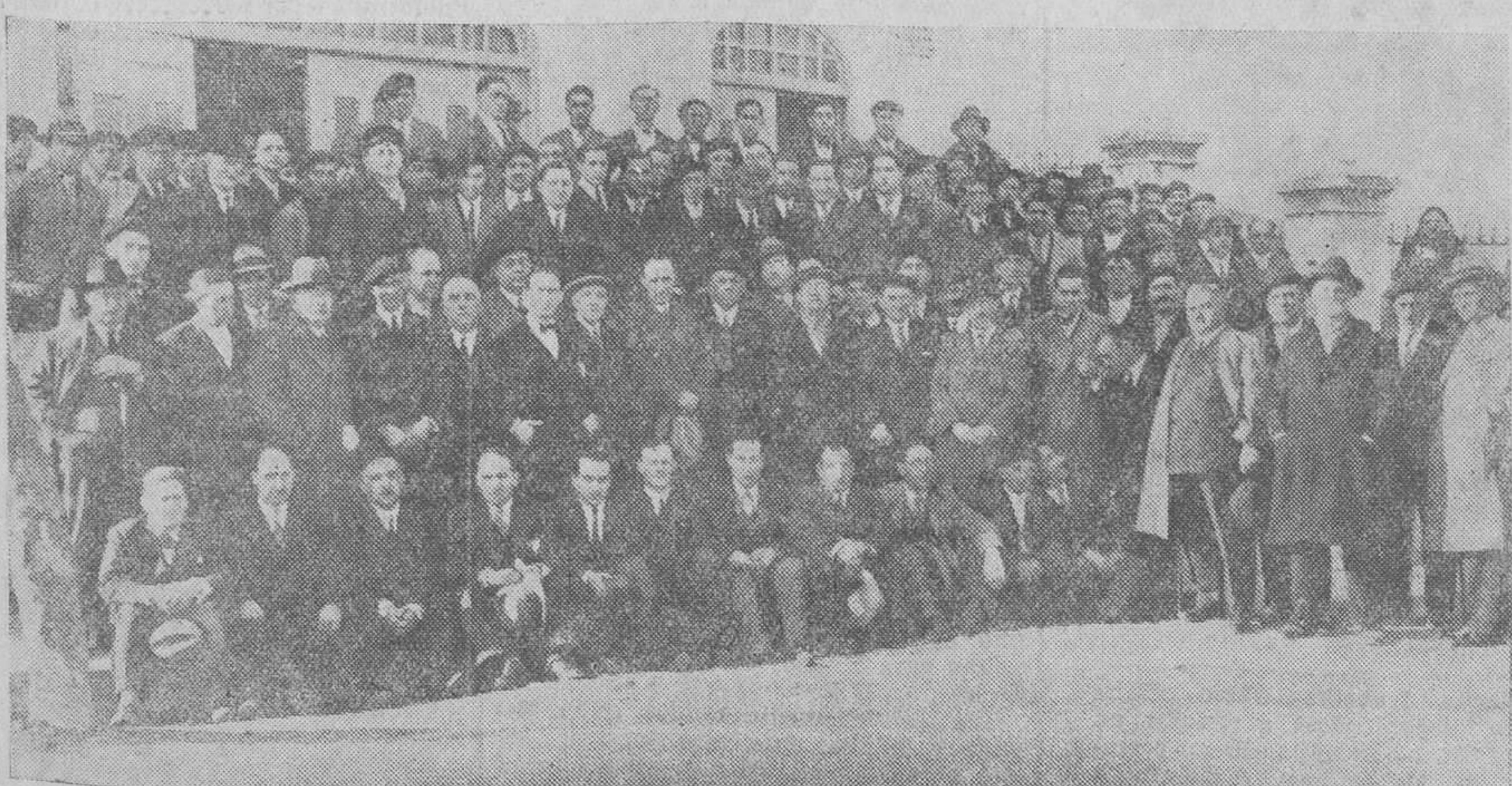
Grupo de diputados en Cortes, concejales y delegados provinciales que asistieron a la asamblea del Partido Acción Republicana.