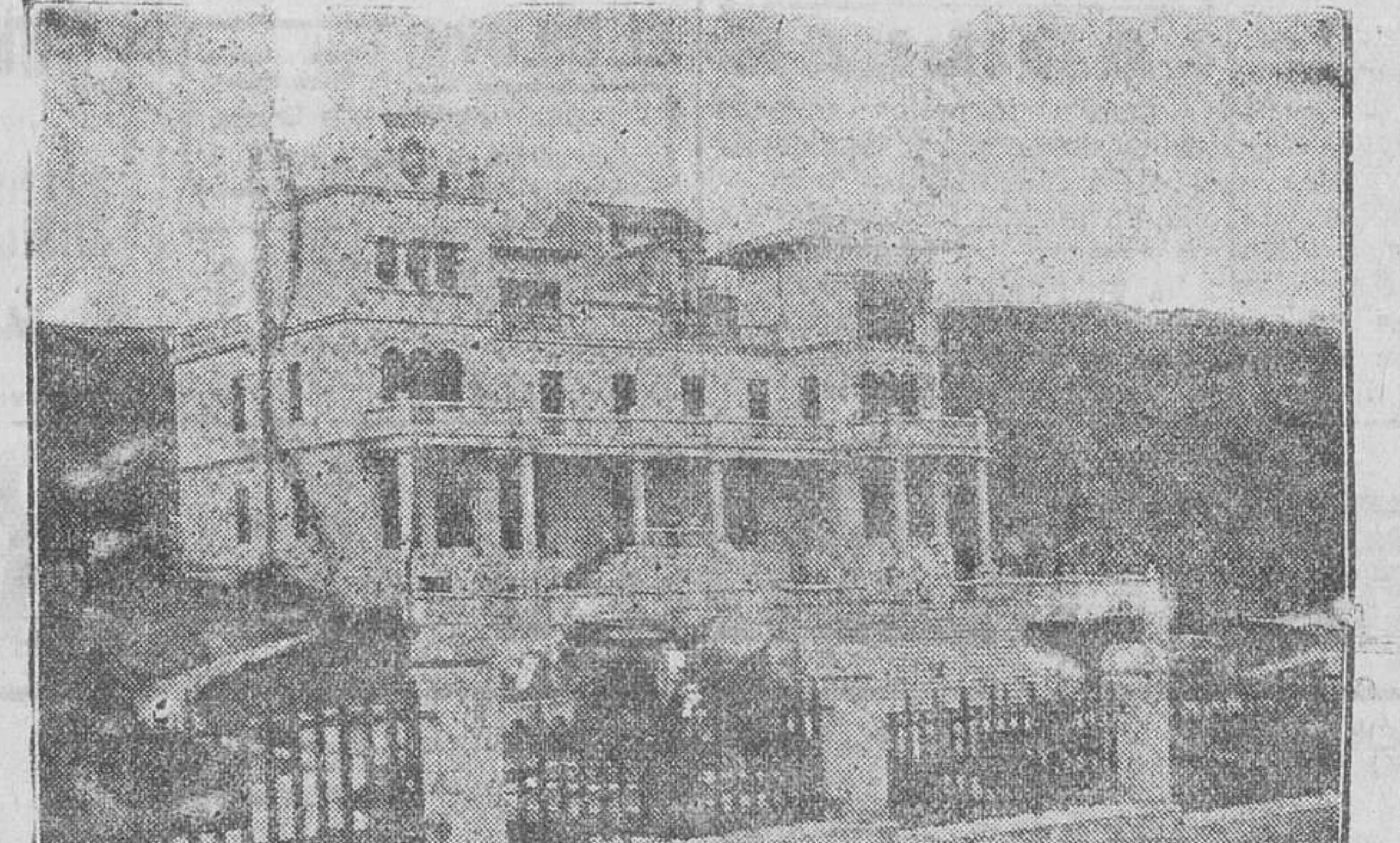
Este sanatorio está principalmente destinado a las enfermedades de los huesos, músculos y articulaciones en sus afecciones tuberculosas, siendo de inmejorables resultados en los estados pretuberculosos, enfermedades de la nutrición, raquitismo, etc., etc. Su bella situación, hermosa instalación y confort le hacen ser uno de los mejores de España.