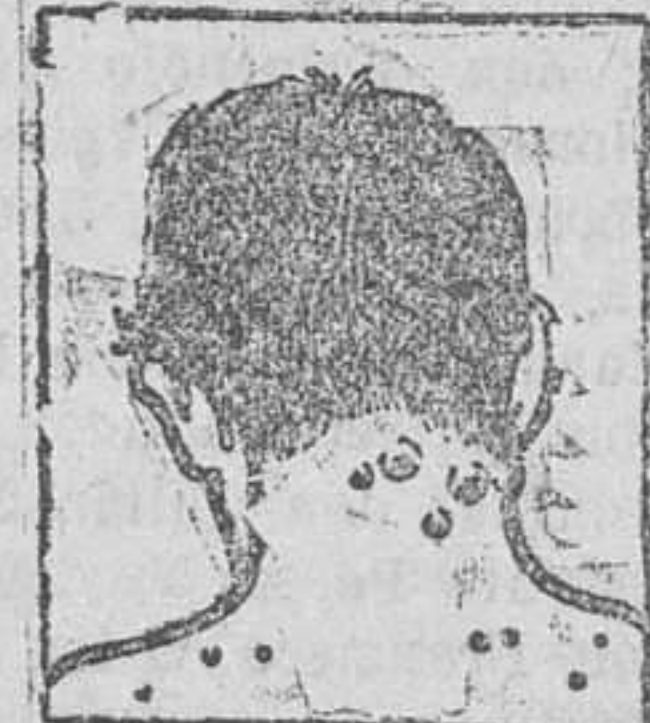
Gota - Forofenicos