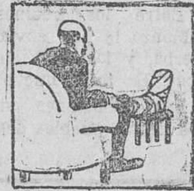
Gota - Dolores