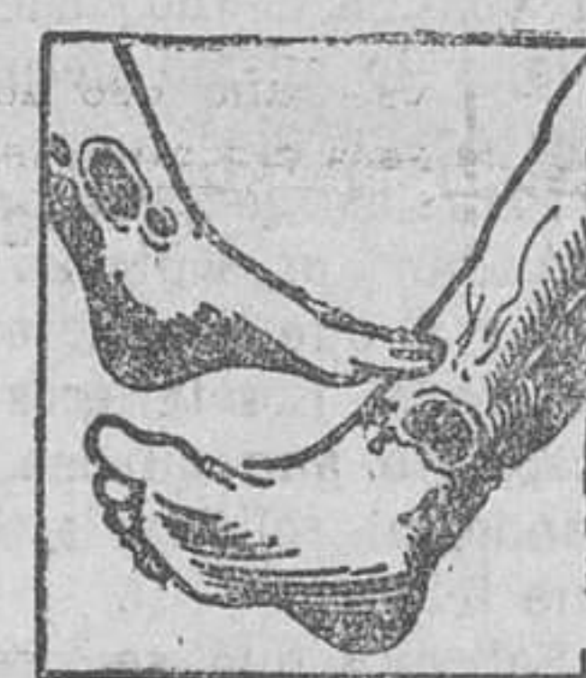
Maies en las piernas

La sangre del artrítico esta entorpecida por venenos que provienen de una insuficiencia de vitalidad y por consiguiente, su circulación es del todo defectuosa. Las piernas del enfermo estan hinchadas y entorpecidas con varices dolorosas con peligro de ruptura o de ulceracion interminable.