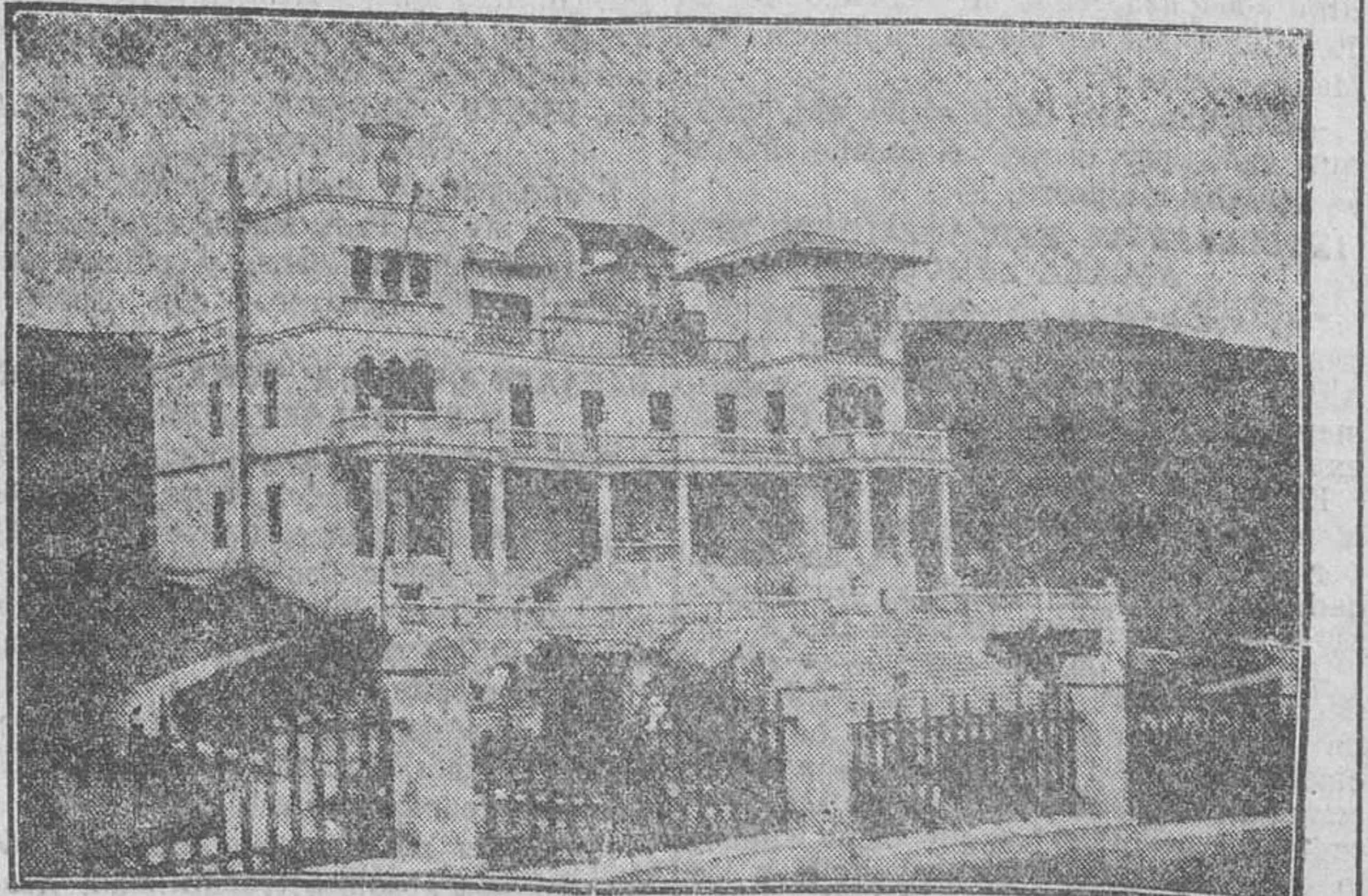
Este Sanatorio está principalmente destinado a las enfermedades de los huesos, músculos y articulaciones en sus afecciones tuberculosas, siendo de inmejorables resultados en los estados pre-tuberculosos, enfermedades de la nutrición, raquitismo, etc., etc. Su bella situación, hermosa instalación y confort lo hacen ser uno de los mejores de España.