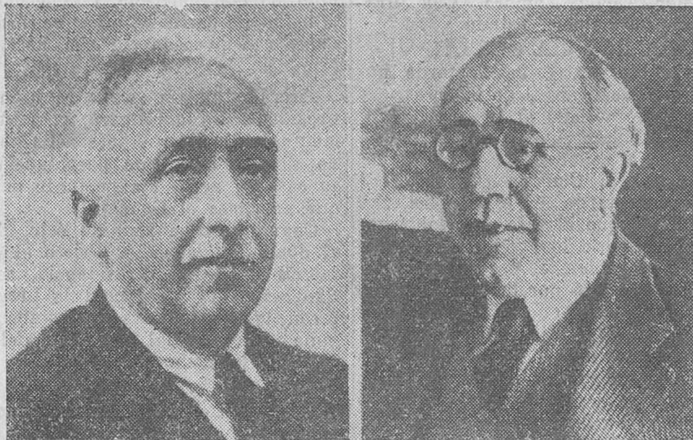
Don Niceto Alcalá Zamora, que ha presentado la dimisión de presidente del Gobierno provisional de la República española por no estar conforme con la votación obtenida por el dictamen de la Comisión de Constitución en la cuestión religiosa, y don Manuel Azaña, presidente del Comité ejecutivo del Partido de Unión Republicana, que aceptó del señor Besteiro el encargo de formar Gobierno.

Recuerda que Venillot dijo: "Vosotros, como sois liberales, tenéis que respetar mis ideas; pero