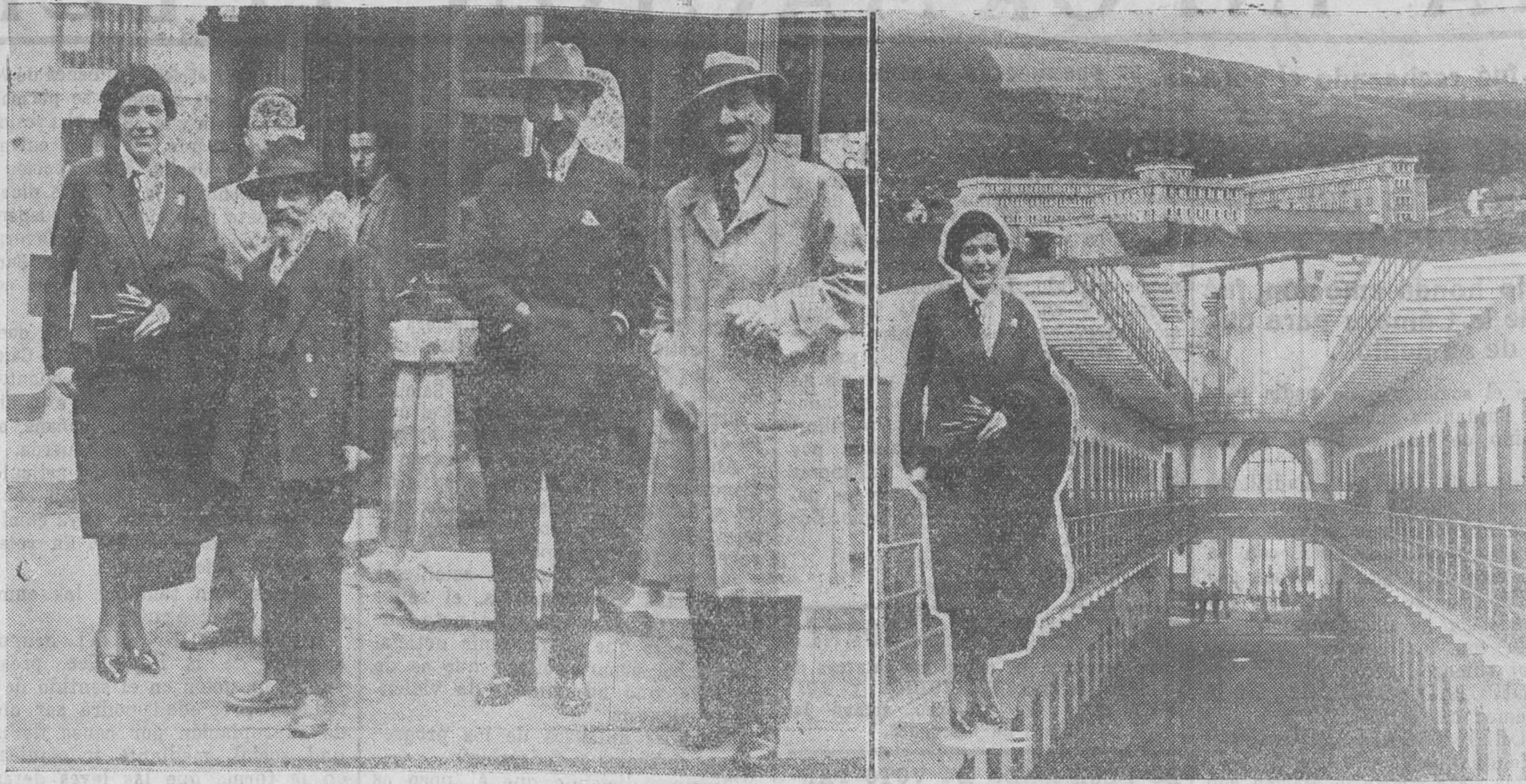
La directora de Prisiones, señorita Victoria Kent, acompañada del alcalde, del presidente de la Audiencia y del gobernador civil, a su llegada a Santander, en la mañana de ayer. — El penal del Dueso, por dentro y por fuera.

La fuerza vestirá de gala, y en la puerta del cuartel se izará el pabellón