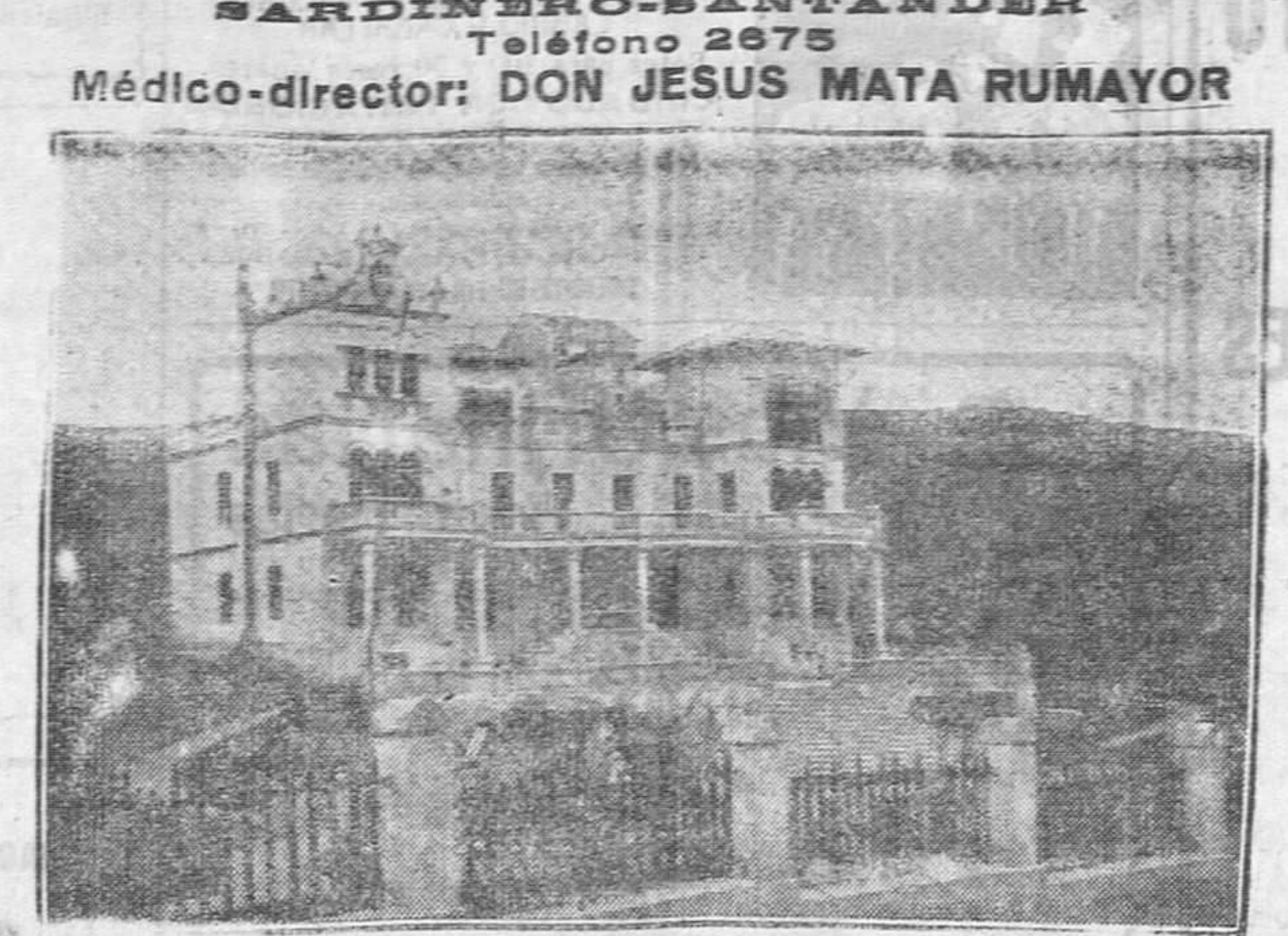
Este Sanatorio está principalmente destinado a las enfermedades de los huesos, músculos y articulaciones en sus afecciones tuberculosas, siendo de inmejorables resultados en los estados pre-tuberculosos...