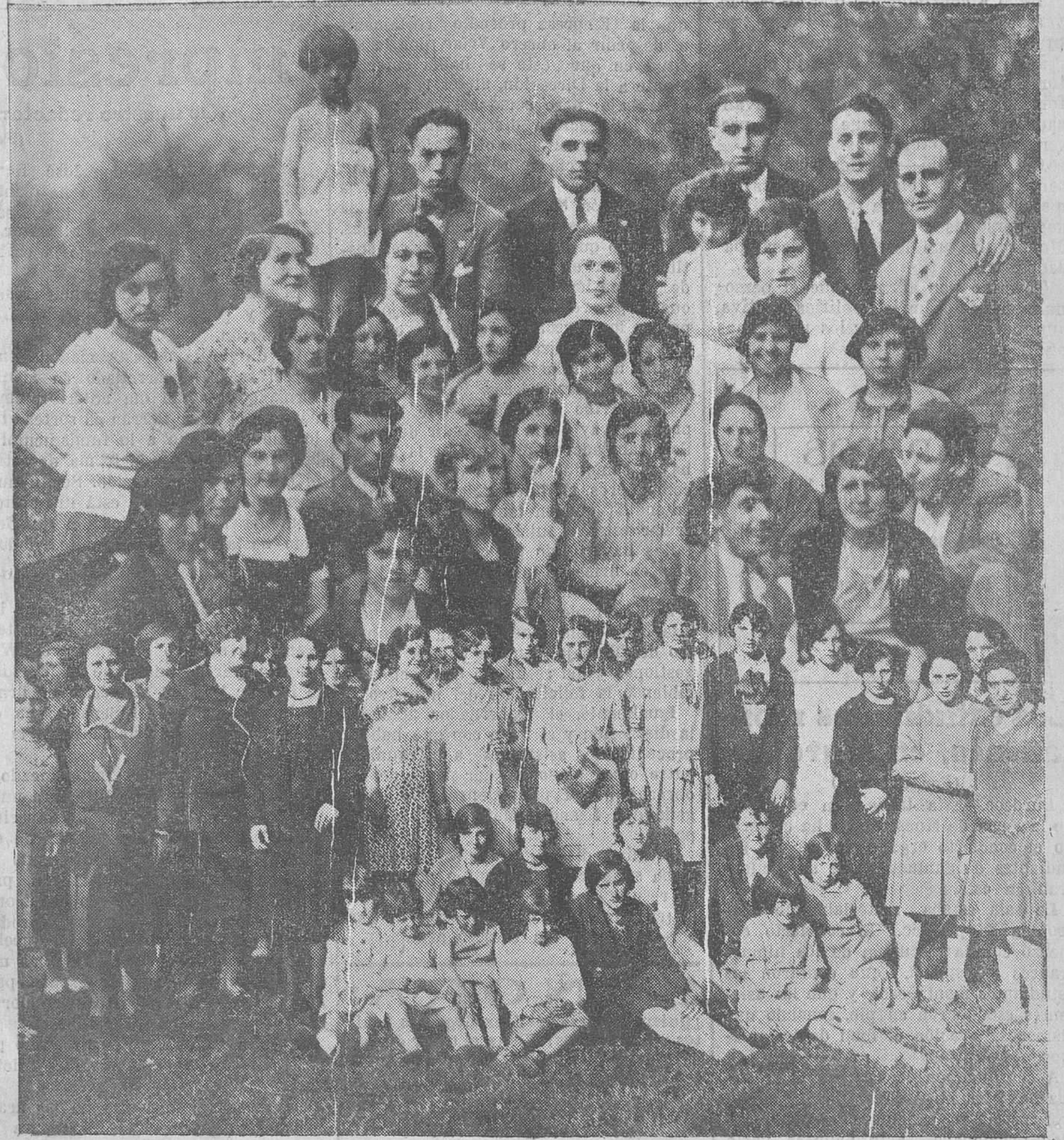
Grupo de jóvenes que acudieron a la romería organizada en homenaje al maestro nacional don Celestino Toriyya, en el pueblo de Mata.

No obstante, y animado por la favorable acogida que los representantes