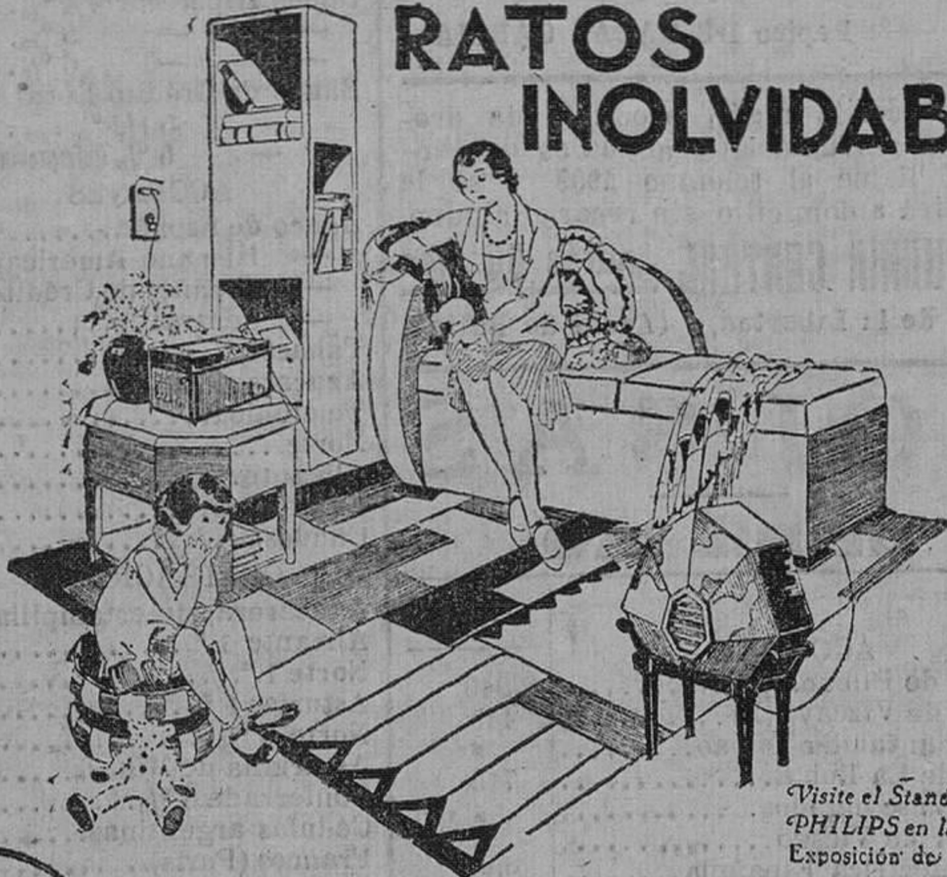
Visite el Stand PHILIPS en la Exposición de Sevilla

Ratos inolvidables de deleite espiritual proporcionan a sus poseedores el RECEPTOR PHILIPS DE LUJO, CON ENCHUFE A LA LUZ Y CON ALTAVOZ ELECTRODINÁMICO. Los más grandes artistas dentro de cada hogar, con fidelidad asombrosa de reproducción y a través de un aparato que es realmente un objeto de arte.