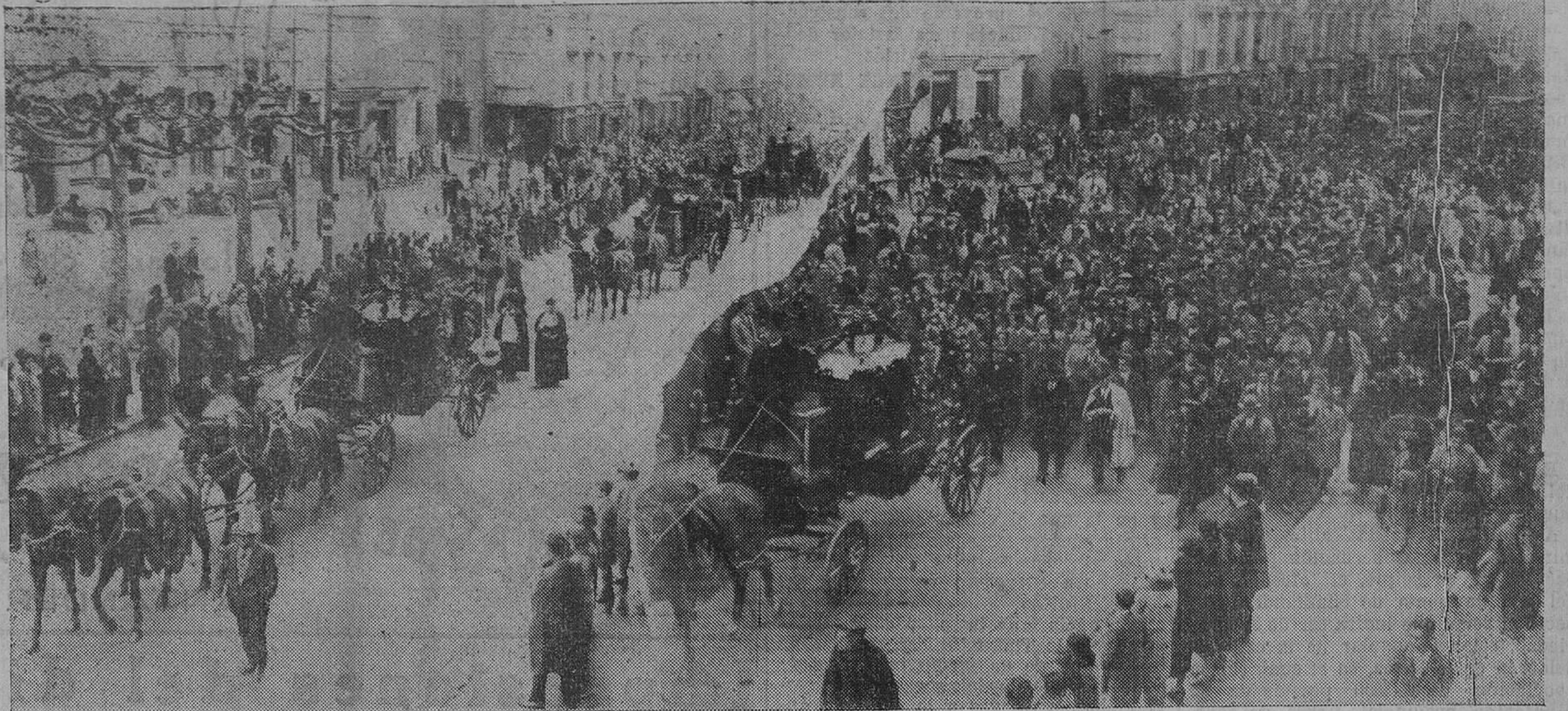
DESPUES DE LA CATASTROFE DE LERMA. — Dos aspectos de la imponente manifestación, que acompañó a los cadáveres hasta la plaza de Numancia.

Partos. - Matriz. - Niños. - Cirugía general. TELEFONO 2419. Marcellino S. de Sautuola, 2.º SANTANDER