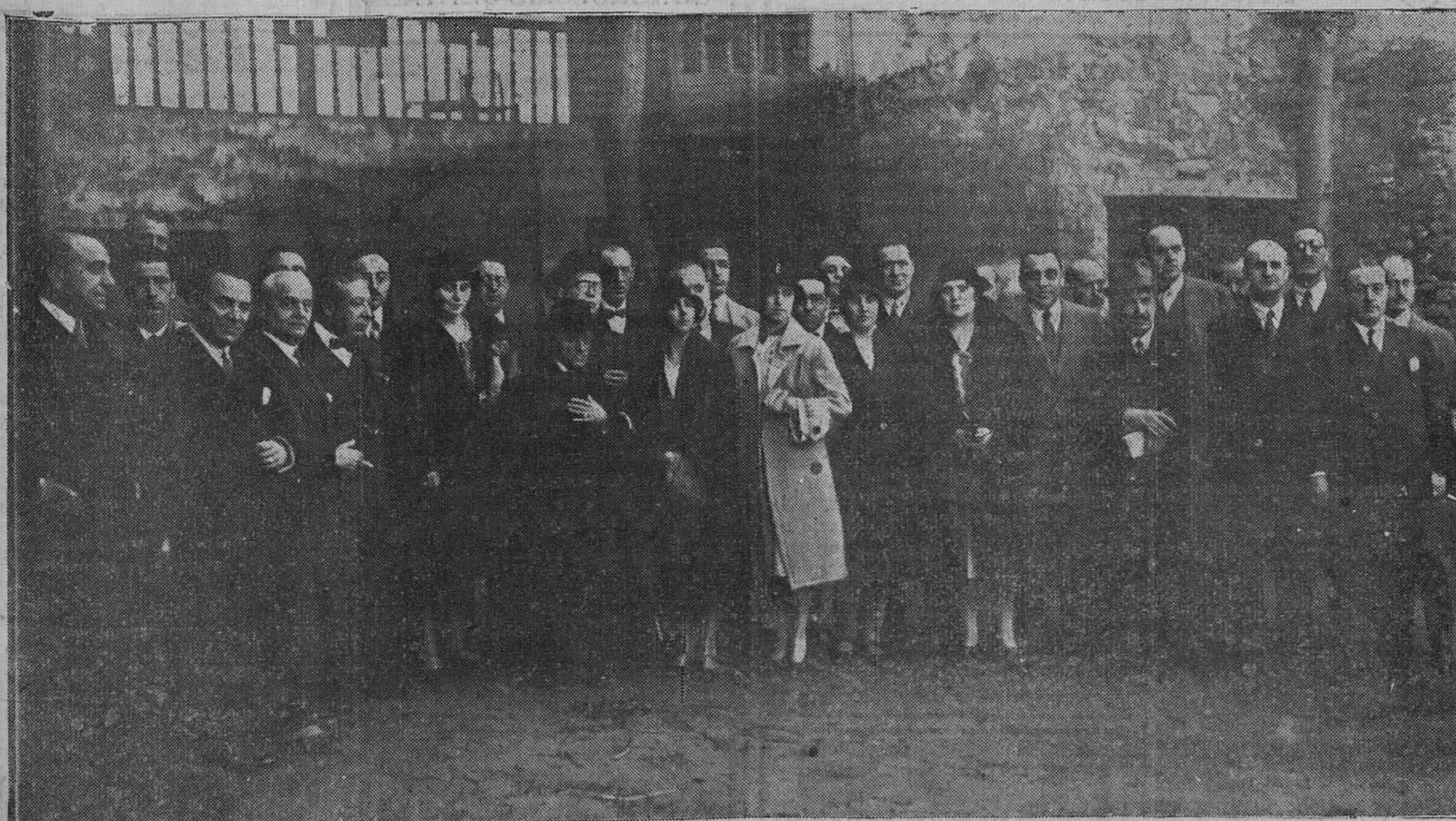
La excelentísima señora marquesa de Pelayo, con el grupo de doctores que han asistido a las conferencias para post graduados, y los médicos de la Casa de Salud Valdecilla, en el "Parador de Gil Blas", durante la visita del domingo a Santillana.

M.º CONACHY DENTISTA PASEO MENENDEZ Y PELAYO, 30. 2.º