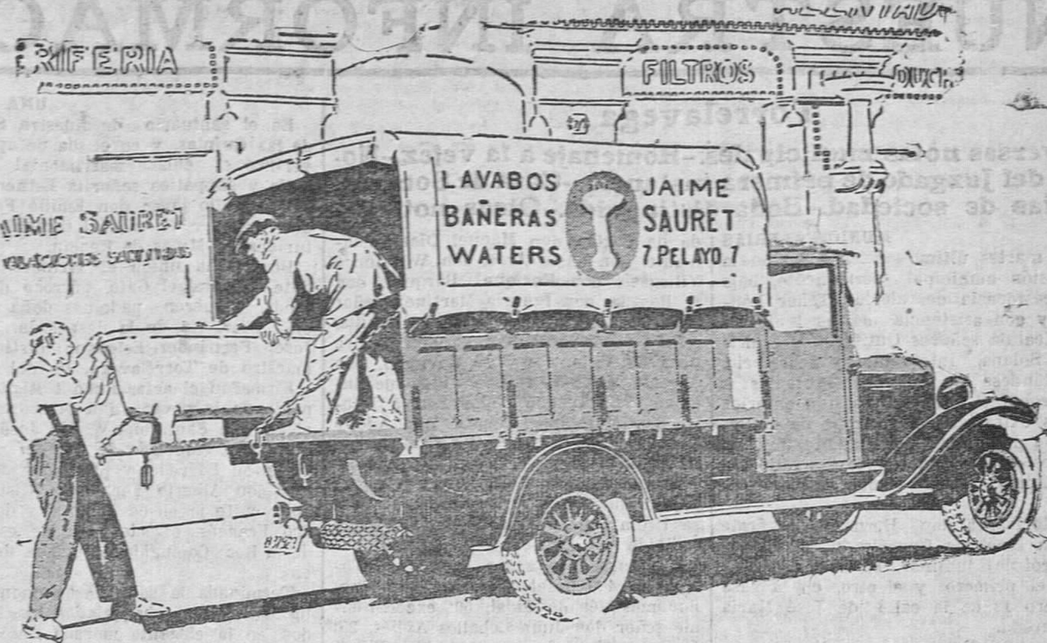
Dice el director de esta importante fábrica: