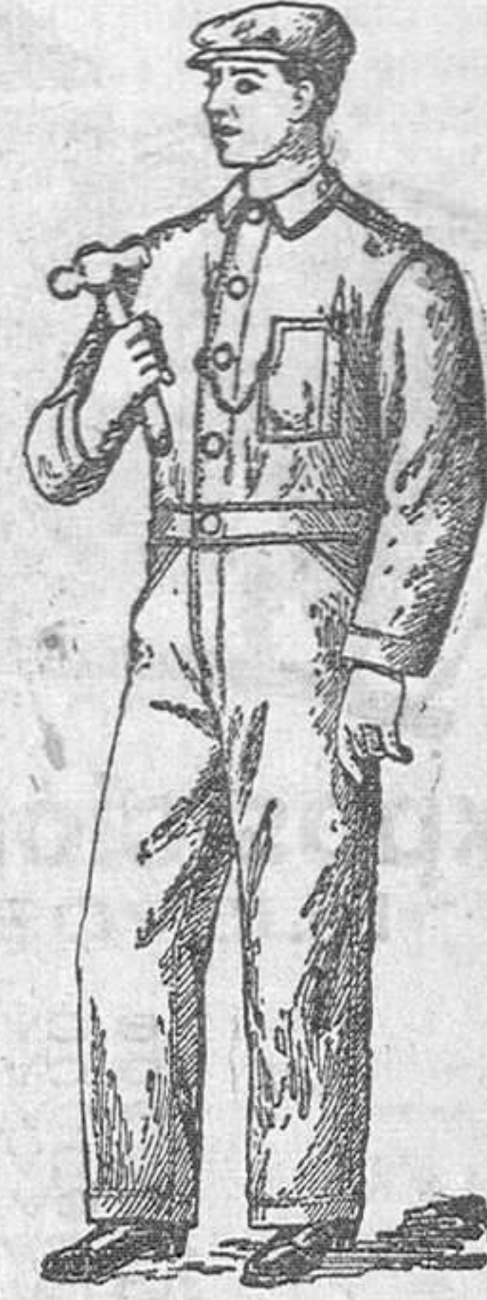
Precio: 18 pesetas.

Deben llevarlos todos los mecánicos, carpinteros y obreros en general, por ser el traje mejor para trabajo.