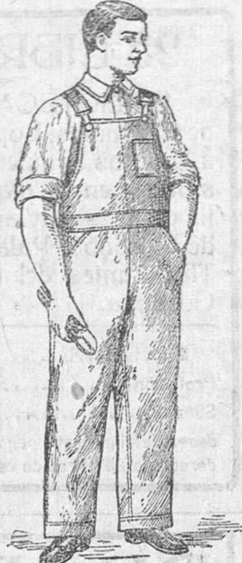
Precio: 12'50 pesetas.

Los más prácticos. Los más económicos, por ser su duración cuatro veces mayor que cualquier otro.