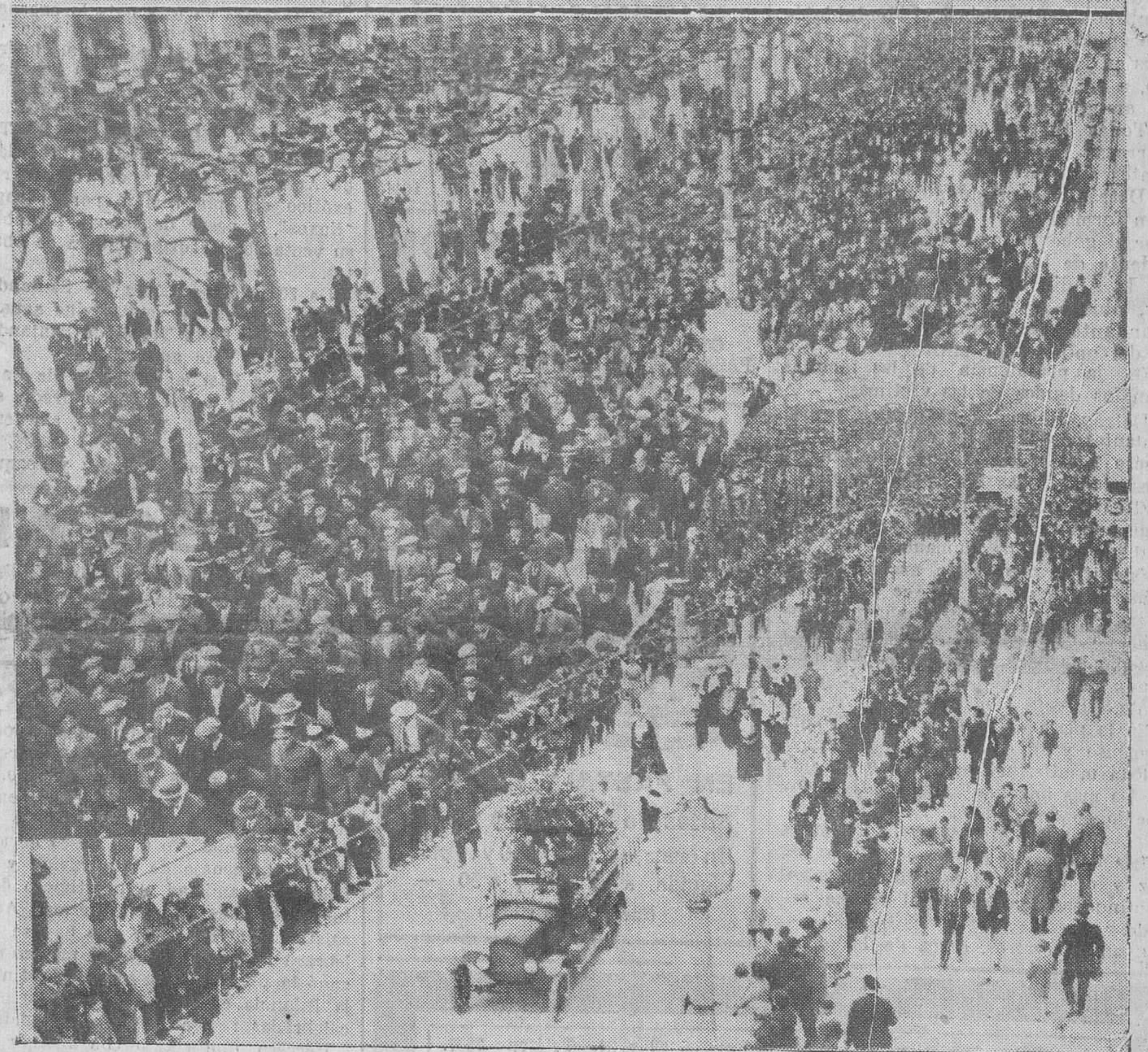
NOTAS GRAFICAS DEL ENTIERRO DE DON ANGEL ROVIRALTA Y DON JOSE HOYUELA. — La presidencia oficial del duelo. — La comitiva fúnebre, a su paso por la calle de Burgos.